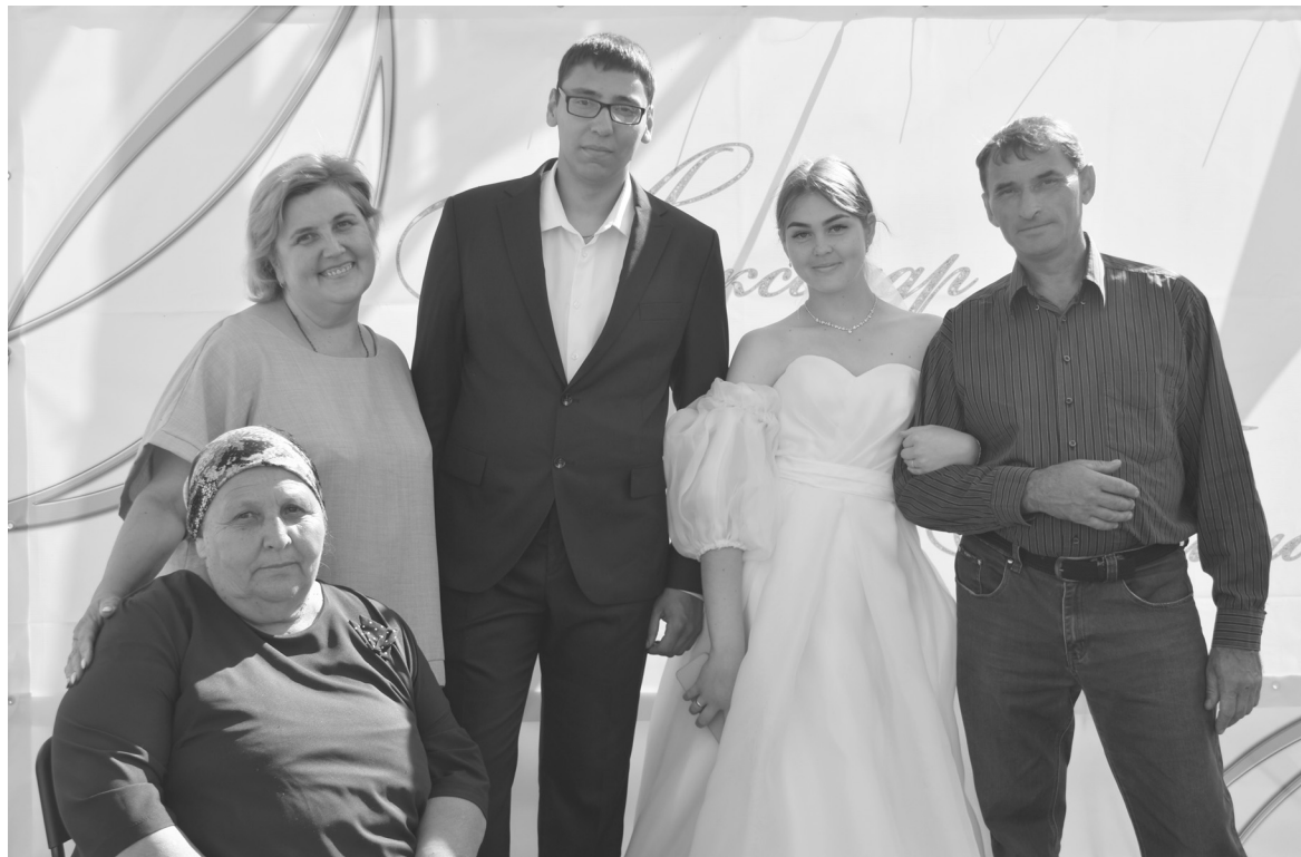
Семья Роговых. Их предки были основателями деревни

Глава муниципалитета подарил жителям Босоногова символическую «чашу достатка»,