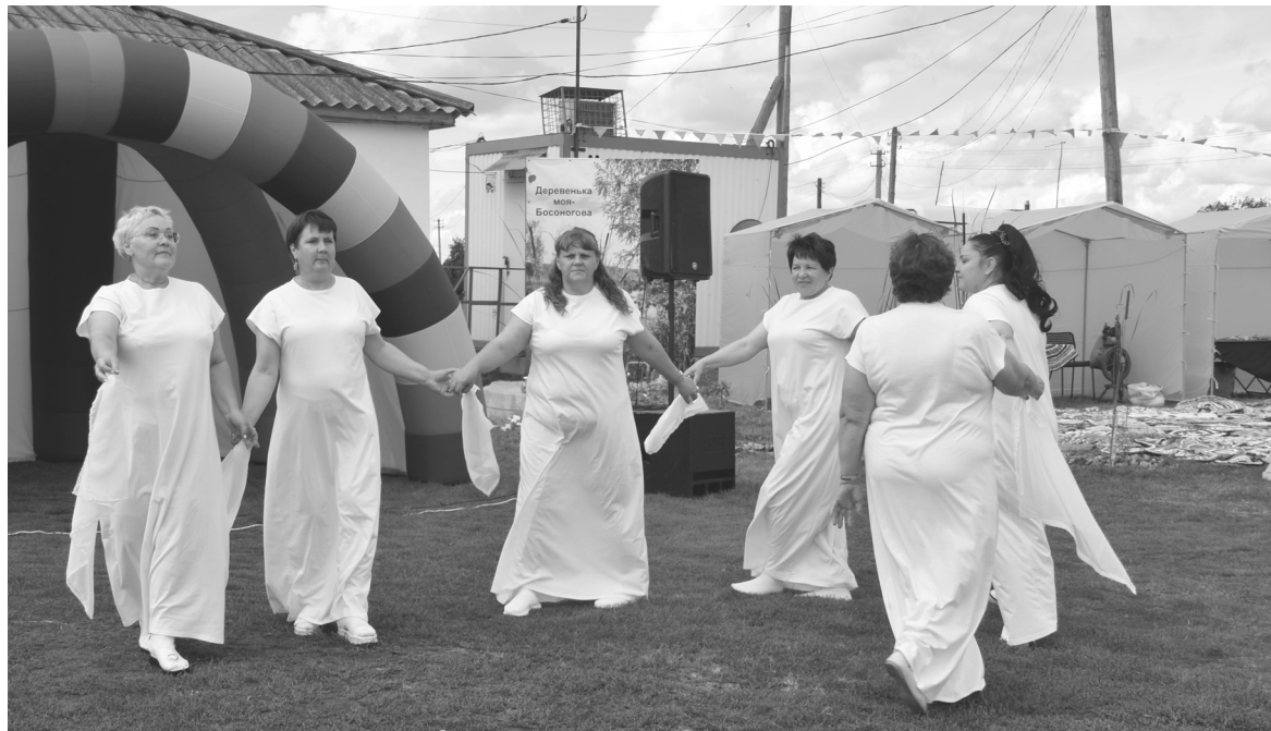
Артисты деревенского клуба порадовали зрителей вокальными и танцевальными номерами

который был приготовлен по старинному семейному рецепту и в формочках, которые хранятся еще от прабабушек. Этот хворост, как воспоминание из детства для Надежды, когда с