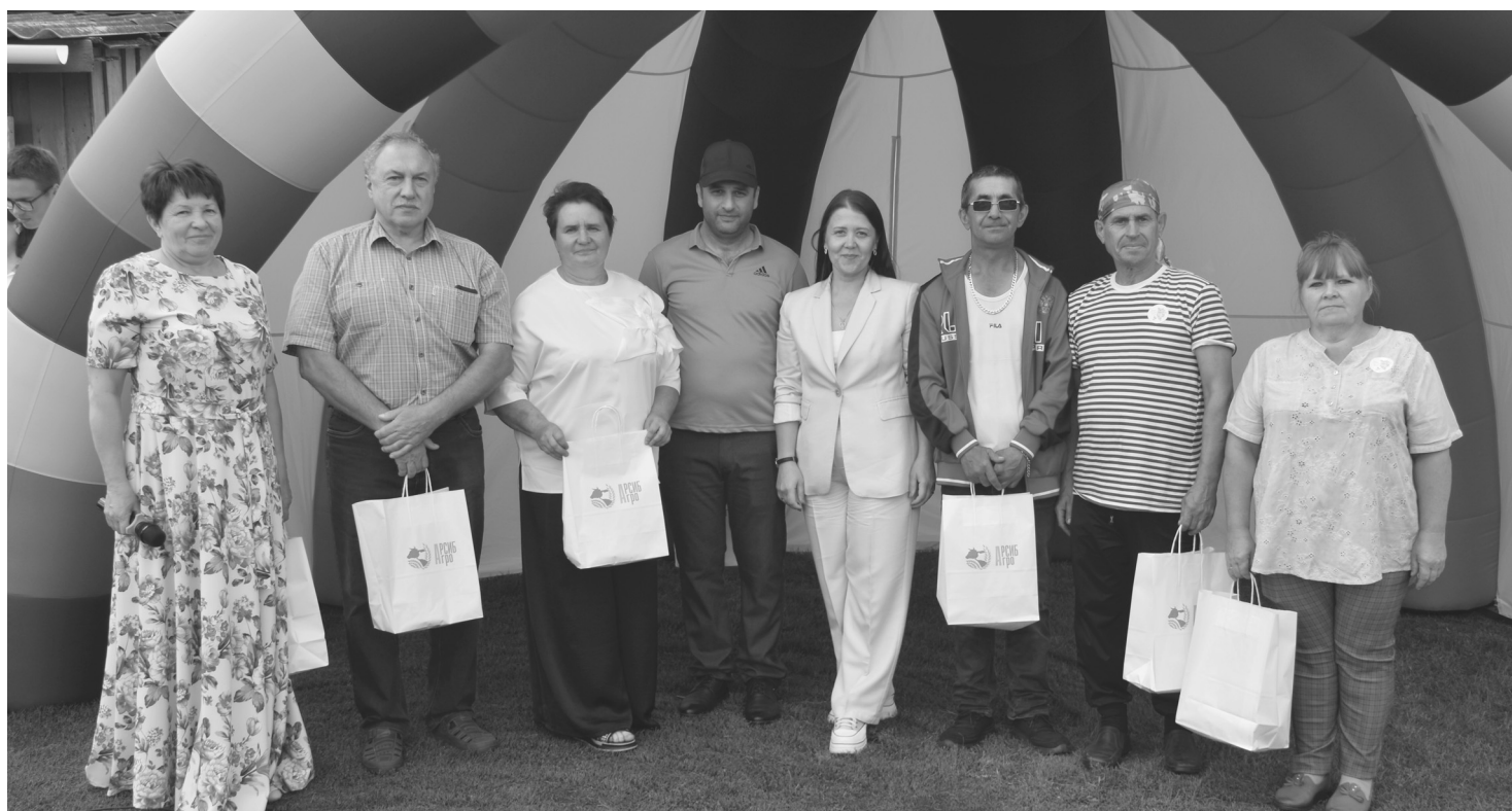
Памятными подарками на празднике отметили жителей деревни, кто сегодня трудится в агрохолдинге «Южный»