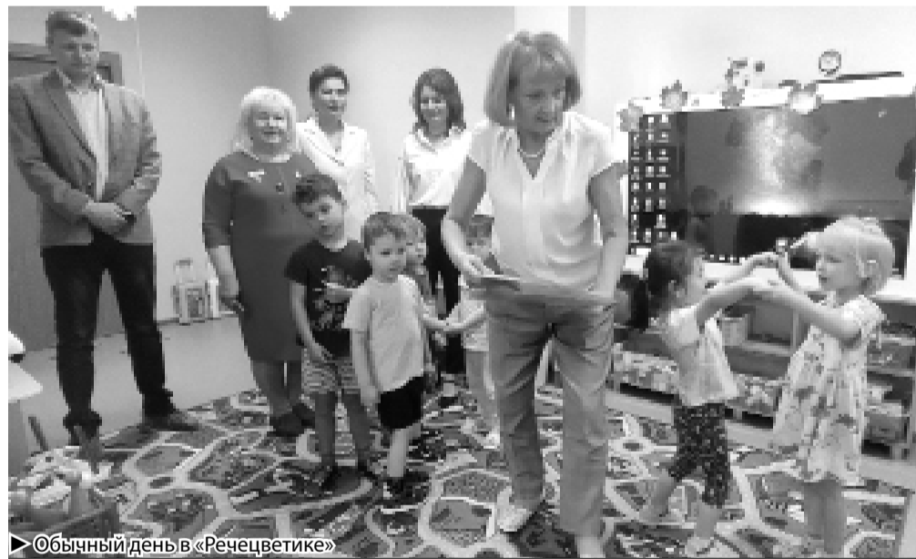
Обычный день в «Речевчике»

АНО «Речевчик» выпустила брошюру, где прописаны «красные флажки РАС», которые помогут родителям на первом году жизни ребёнка справиться с ними самостоятельно и настроиться в случае каких-либо совпадений с «флажками». Должны настроить родителей следующие моменты в развитии ребёнка: если нет указательного жеста