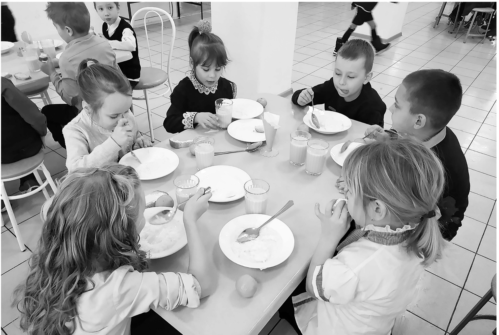
Ребяшки с удовольствием уплетают всё, что приготовили сегодня на обед первоклассные школьные повара. Светлое помещение, новые столы и стулья, красивая посуда и весь класс за компанию усиливают аппетит.

Владимир Путин предложил обеспечить бесплатным горячим питанием всех школьников с 1-го по 4-й классы