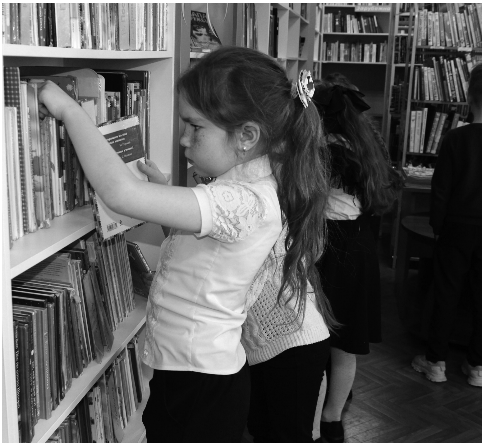
После мероприятия школьники выбрали книги для чтения по своему вкусу