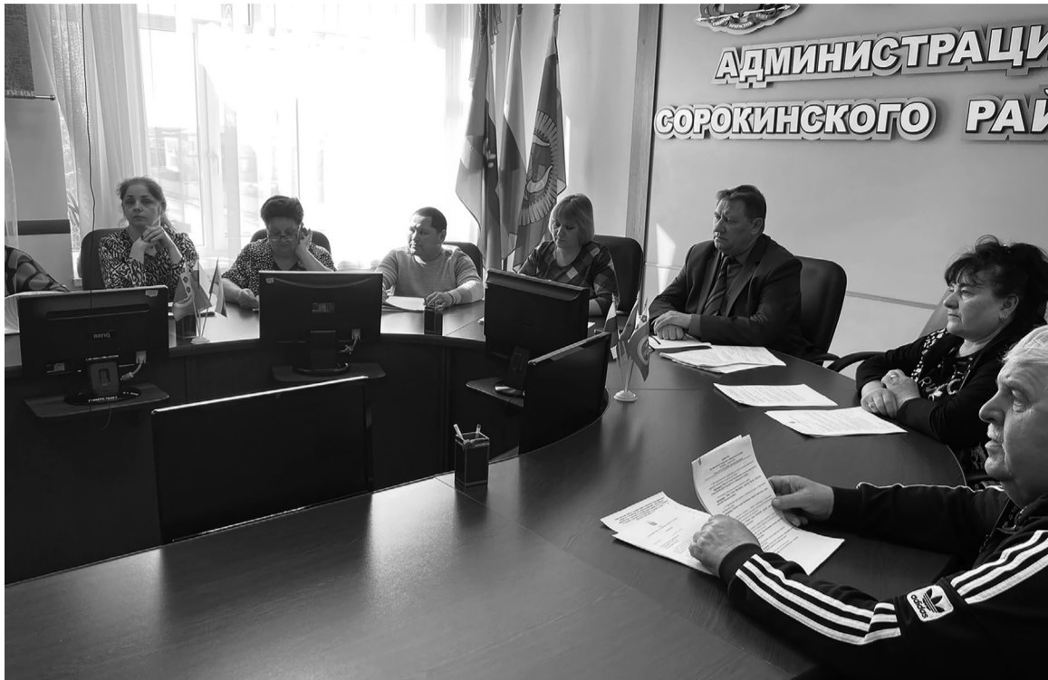
Ряд важных вопросов обсудили районные депутаты на заседании Думы

- собакам крупных пород лицами младше 14 лет; - без намордника и поводка (на придомовой территории); - без намордника и по-