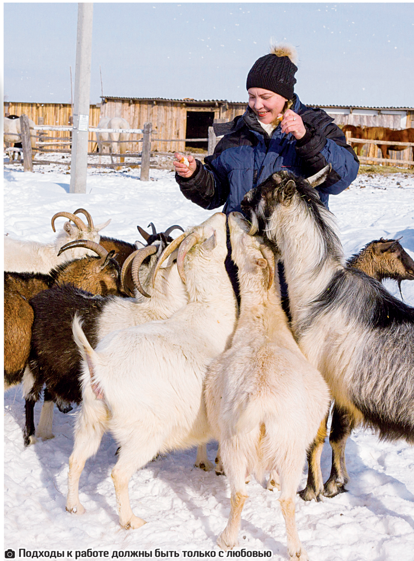
Подходы к работе должны быть только с любовью

А недавно из Югры сюда привезли трёх северных оленей: Зевса, Снежинку и Машу. К тому же важенки в интересном положении. В этой публикации мы перечислили не всех здешних обитателей, но встреча с ними будет столь же интересна для будущих посетителей экологической фермы, а в мае здесь ждут прибытия ещё целой группы животных и птиц, среди которых будет даже верблюд.