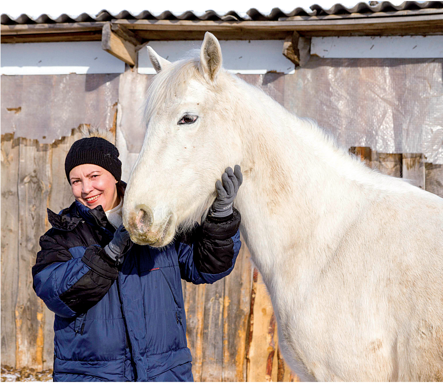
«Я занимаюсь любимым делом!»

– Я считаю себя очень счастливым человеком, потому что занимаюсь любимым делом. Убеждена, что человек в первую очередь должен жить в гармонии с самим собой, заниматься своим делом, вкладывая в него частичку своего сердца. Тем более в сельском хозяйстве подходы к работе должны быть только с любовью.