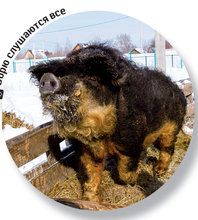
Боря слушается все

видом они выносливые, с сильным иммунитетом, благодаря своей шерсти не боятся низких температур, даже зимой хорошо себя чувствуют в открытом вольере. Содержание мангалиц обходится много дешевле, нежели уход за другими породами свиней, например, за ландрасами, которых здесь также разводят. Ландрасы наиболее прожорливы, достаточно капризны в содержании. Кроме того, мангалицы очень умы и контактны. Поросята быстро привыкают к человеку,