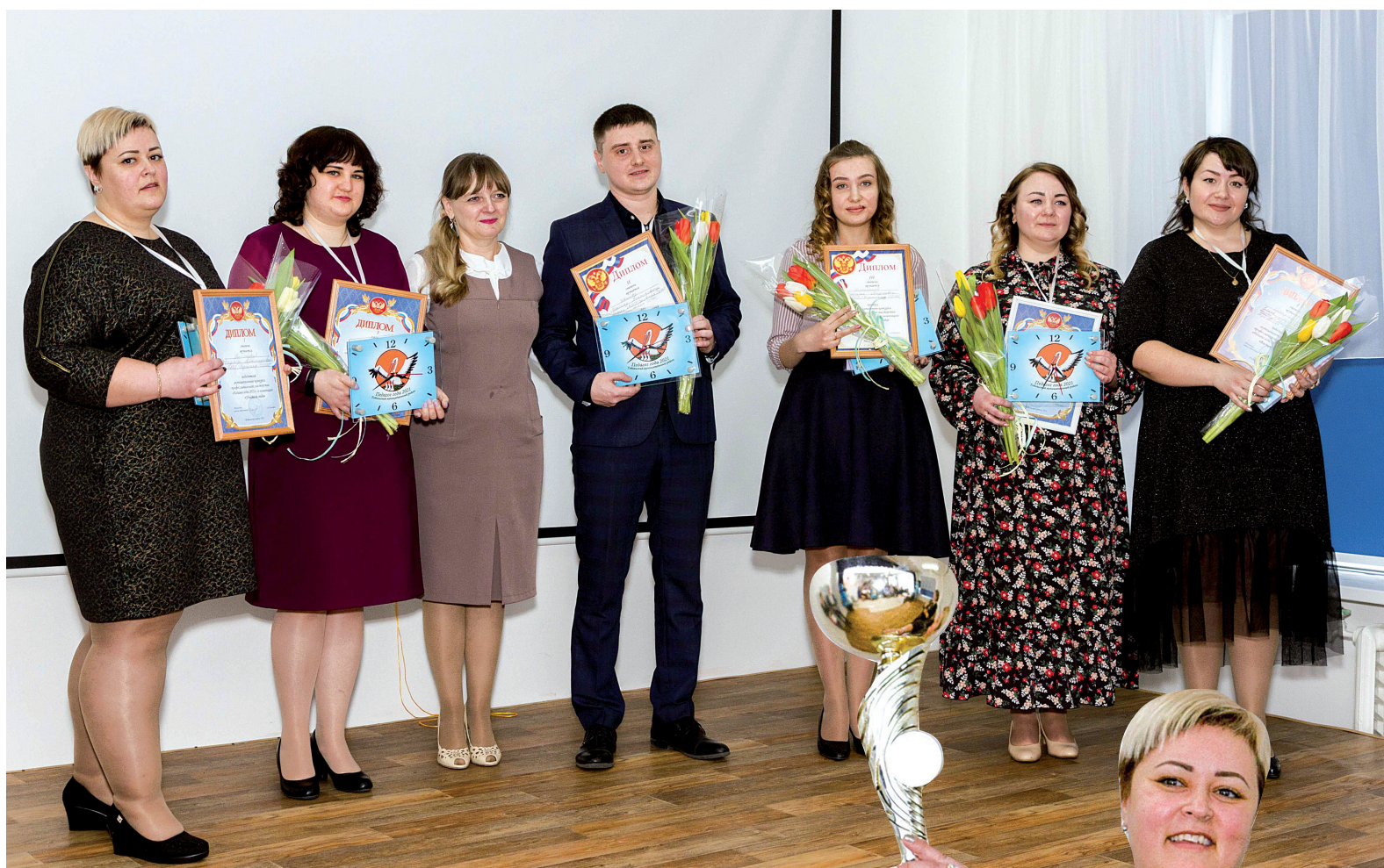
Главские виновники торжества

Подвёл итоги районный конкурс «Педагог года – 2021». На базе Бизинской школы завершился очередной районный конкурс на звание лучшего по профессии среди работников образования.