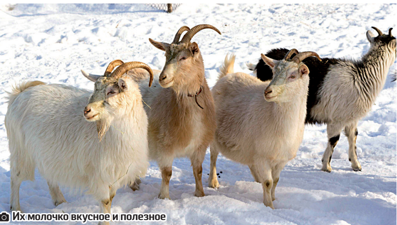
Их молочко вкусное и полезное

ставители молочного направления – альпийской, чешской, зааненской, горьковской пород. Всю эту рогатую и безрогую компанию сопровождала свинья Муся. Это звезда хозяйства, легка на контакт, артистичная, игривая, от коз не отходит ни на шаг. Даже порою на ночлег к ним приходит. И, как мы поняли, хрюня всегда рада гостям. Своим пятачком исследовала каждого из корреспондентов, особенный восторг у неё вызвал фотограф, и, куда бы