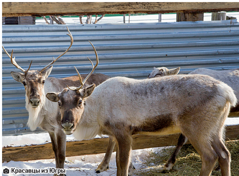
Красавцы из Югры

Идейная команда. Пусть ещё не выбрано название будущему проекту, и многие из его направлений пока держатся в секрете, в целом идеи медянских фермеров нашли положительный отклик в Россельхозбанке и районной администрации, со стороны руководства Ворогушинского сельского поселения проект тоже вызывает только одобрение.