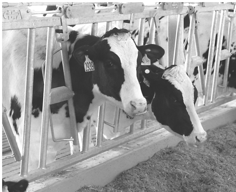
Хотите купить молодых стельных коров – вам в ТМФ

Появление репродуктора на территории Тюменской области вносит серьёзный вклад в укрепление племенной базы российского молочного ското-