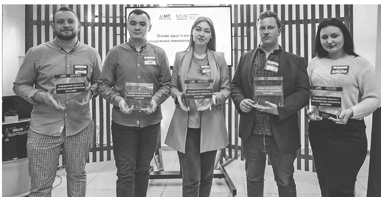
Инициативная группа «Специалисты Голышмановского центра культуры и досуга» на защите своего проекта

Тридцать три команды защищали свои проекты на областном конкурсе молодёжных инициатив «Моя идея».