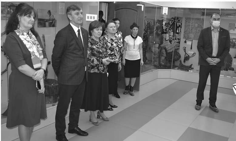
На открытии выставки по итогам исторических трибуналов над фашизмом

Дата её проведения выбрана не случайно. 19 апреля 1943 года был издан Указ Президиума Верховного Совета СССР «О мерах наказания для немецко-фашистских злодеев, виновных в убийствах и истязаниях советского гражданского населения и пленных красноармейцев, для шпионов, изменников Родины из числа советских граждан и для их пособников». В наши дни эта дата отмечается как День единых действий в память о жертвах геноцида.