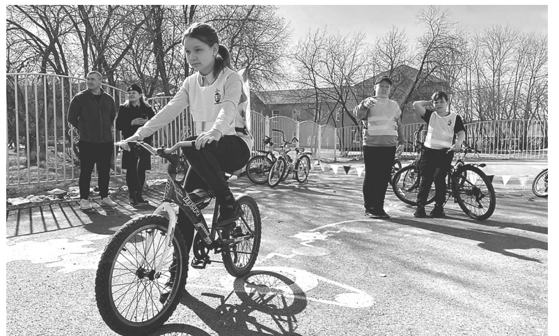
На пути до финишной черты

Любовь АЛЕКСЕЕВА