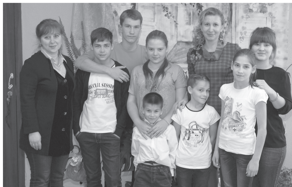
В одной из групп детского дома

ФК «Тобол» вновь занимает второе место в Первенстве. Это уже третье серебро в истории клуба. Ранее медали этой пробы «Тобол» выигрывал в 2006 и 2013 годах. А всего за последние десять лет это уже седьмое призовое место команды. В медальной копилке «Тобол» одно золото, три серебра и три бронзы. Есть и Кубок Урала, и надежда взять этот трофей в нынешнем сезоне.