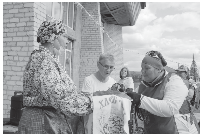
Традиционная встреча с хлебом-солью в Староалександровке

Следующую остановку туристы сделали в Староалександровке. В центре поселения гостей приветствовали хлебом-солью на русском, татарском и зырянском языках местные жители. В