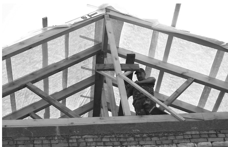
Тюменские строители ремонтируют кровлю школы № 4 посёлка Голышманово

На время ремонтных работ в школе № 4 в посёлке Голышманово детский при-