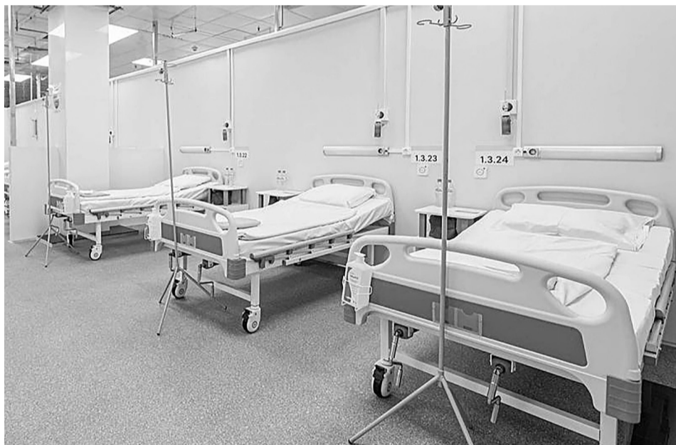
Коечный фонд для оказания помощи пациентам с COVID-19 и тяжёлыми формами пневмонии снова увеличен. В регионе развёрнуто более 3000 коек. На сегодня функционирует 16 специализированных учреждений, среди них – Областная больница № 15 (с. Нижняя Тавда), где предусмотрено 30 коек для больных.

В Методических рекомендациях Минздрава сказано, что подозрительным на COVID-19 считается случай, когда у пациента температура выше 37,5 °С и есть один или более из следующих при-