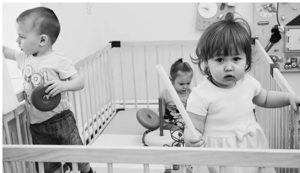
Пока родители трудятся на профессиональном поприще, ребята ясельной группы «Зайчики» находятся под чутким присмотром воспитателей.

быстрее социализироваться, научат выстраивать отношения с другими детьми. А мамочки в это время могут свободно заниматься профессиональной деятельностью. Это именно тот случай, когда в