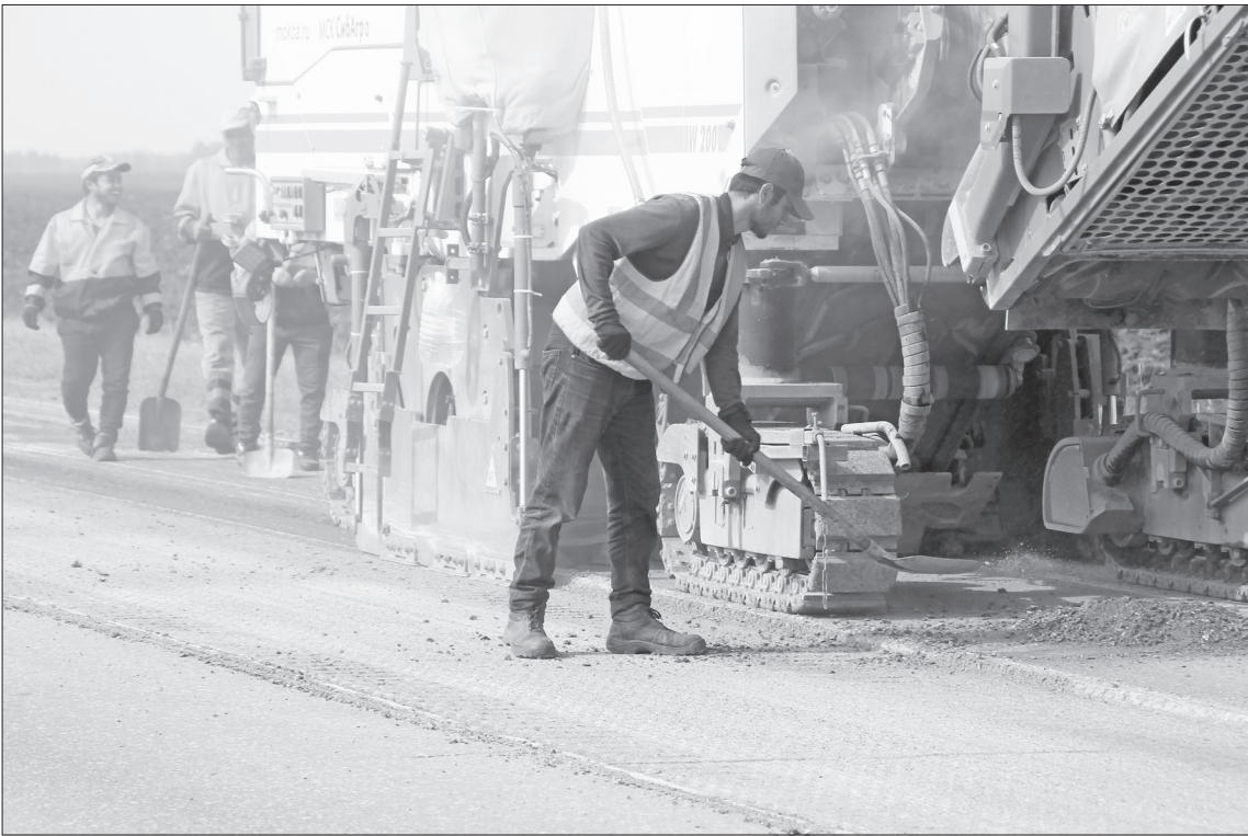
📷 С помощью машины под названием фреза идёт процесс срезки асфальта. А дорожный рабочий убирает упавшие остатки материала.

Ремонт начался 23 августа, в начале сентября планируется его завершение. К вы-