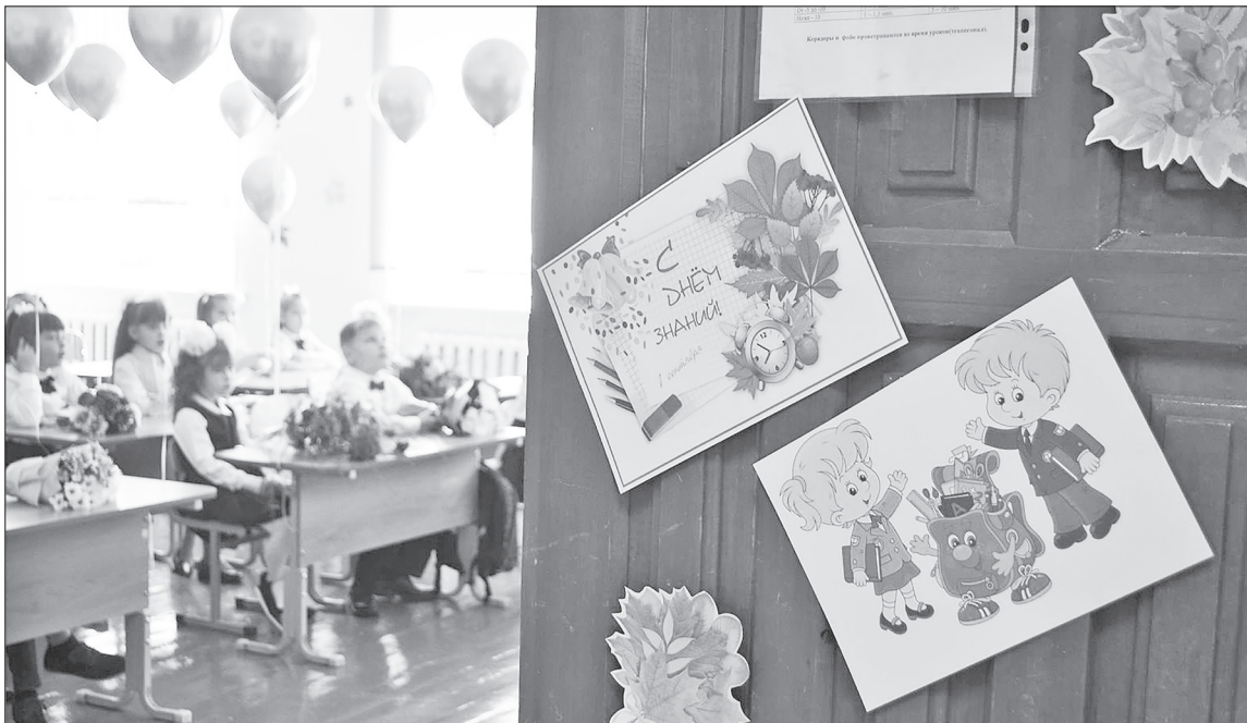
■ Скорее школьники района сядут за парты. Войти в новый учебный год без проблем помогут педагоги и родители.

– С любым ребёнком любого возраста, даже пусть это десятиклассник, нужно обязательно выбрать безопасный маршрут в школу. Нужно просто взять ребёнка за руку и вместе с ним пройти по тем маршрутам, которыми он теперь будет ходить каждый день. Это маршрут в школу и обратно, в магазин, в спортивную секцию или в учреждение дополнительного образования. В первую очередь нужно обратить внимание на то, где переходить дорогу и как правильно её переходить. По поводу светофора, надеюсь, всем понятно. Переходим только на зелёный сигнал, при этом нужно убедиться, что водители вас пропускают. Что касается нерегулируемого пешеходного перехода, то здесь может возникнуть проблема. Ребёнок должен твёрдо знать: он не может начинать переход, не убедившись, что водитель его видит, пропускает, остановился. Каждую полосу движения он должен держать под контролем. Прошёл, остановился, посмотрел, что там, и так до того момента, пока полностью не закончит переход. У ребёнка должен быть точный настрой на правила перехода, на правила безопасности: идти, а не бежать, снять наушники, не пользоваться телефоном,