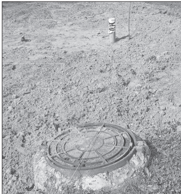
📷 Улица Ленина, Нижняя Тавда. Место для стационарного туалета почти подготовлено. Никакого дискомфорта у жителей близлежащих домов уборная не вызовет – территория оснащена всеми необходимыми коммуникациями.

зованных уличных туалетов. Однако вопрос чистоты и бережного отношения к общественному имуществу поднимать всё-таки следует. Без должного ответственного подхода со стороны потребителей услуги туалеты вряд ли долго простоят в первозданном виде. Так что, граждане, давайте уж как-нибудь без вандализма. «Если я, входя в уборную, начну, извините за выражение, мочиться мимо унитаза, и то же самое будут делать Зина и Дарья Петровна, в уборной начнётся разруха. Следовательно, разруха не в клозетах, а в головах», – как сказал профессор Преображенский, герой повести Булгакова «Собачье сердце».