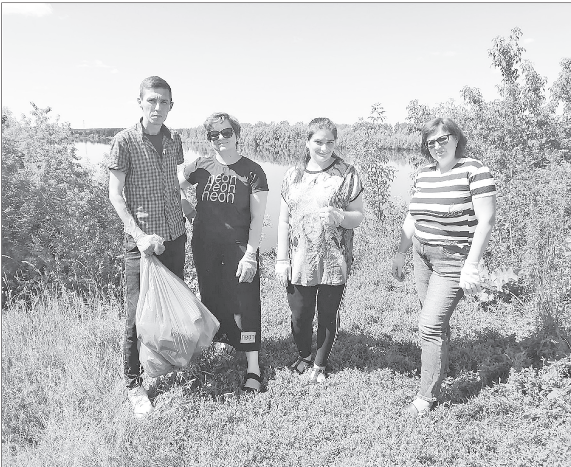
Редакционная команда собрала мусор на берегу реки Тавды.

Редакционный патруль в деле. А мы решили пойти ещё дальше и организовали внеочередной экологический