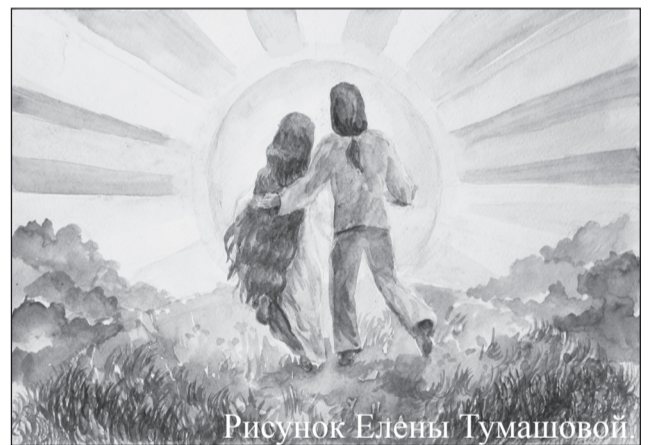
Рисунок Елены Тумашовой

Весна традиционно является временем года, когда возобновляются работы по очистке населённых пунктов от накопившегося за зиму мусора. Нынешний год особый – Год экологии, а для нашего района ещё и юбилейный.