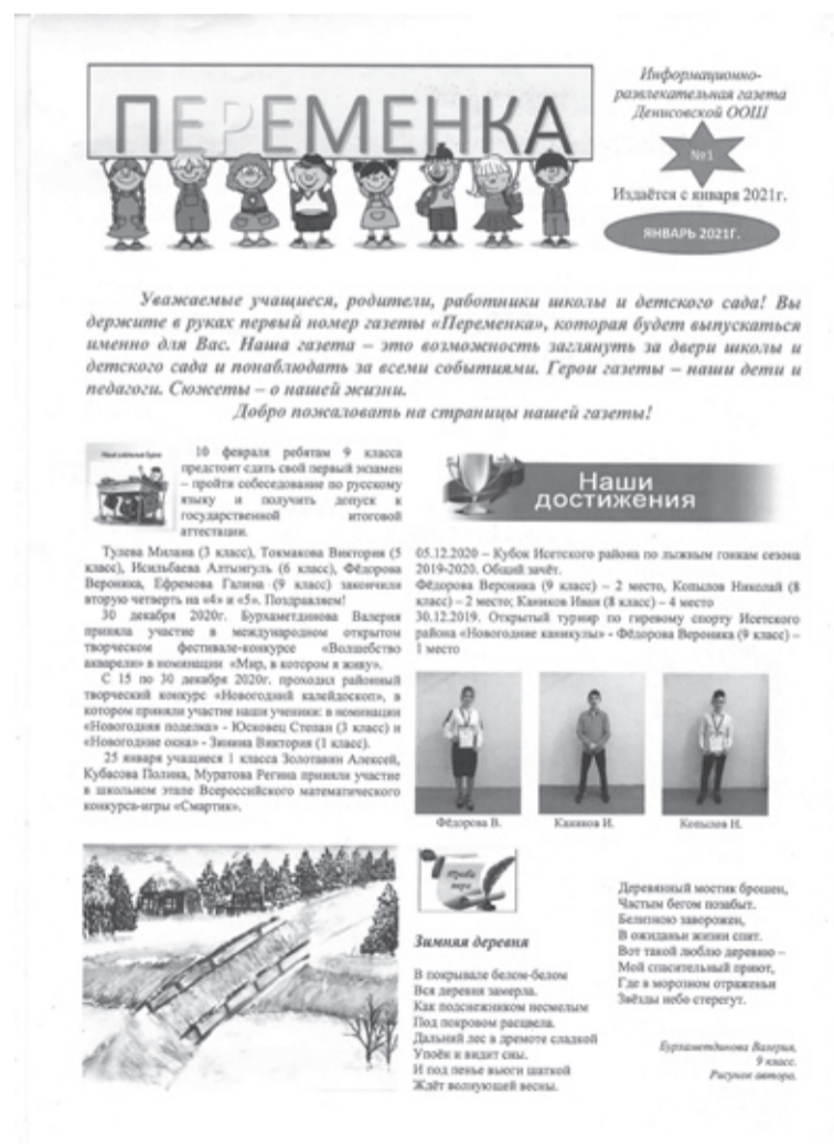
|| Первый выпуск «Переменки»

товить девятиклассники, третий – седьмой и восьмой классы. Очередь распределена до первого июня. Подбор материалов для каждой рубрики тоже написан, то есть ребята и их классный руководитель уже знают, что и о чём они напишут в этот номер. Если это статья под рубрикой «Выходные с пользой», то дети не просто пошли на ка-