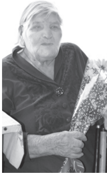
|| Фото автора

– Отца забрали на фронт с первых дней войны. Нас было четверо ребятшек. Маме пришлось трудно, она много работала. Мы ей помогли, руками пополю пшеницу. Представляете, какие большие поля приходилось обрабатывать? Пока кто-то не заметил, что я ещё