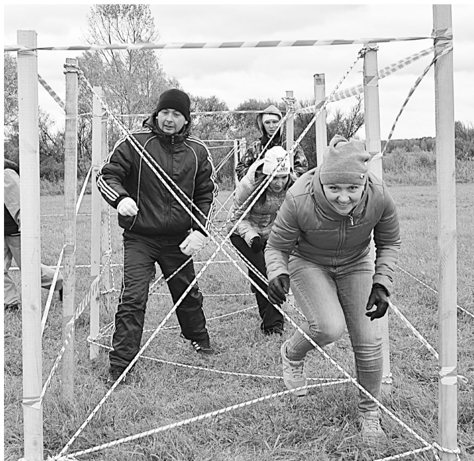
Команда МАОУ «Нижнетавдинский детский сад «Колосок» готовится к старту.

По результатам всех четырёх этапов МАОУ «Велижанская СОШ» закрепились на третьей строчке итогового протокола. На втором месте – работники образования из Киндера. Абсолютным победителем стала команда Тарман-