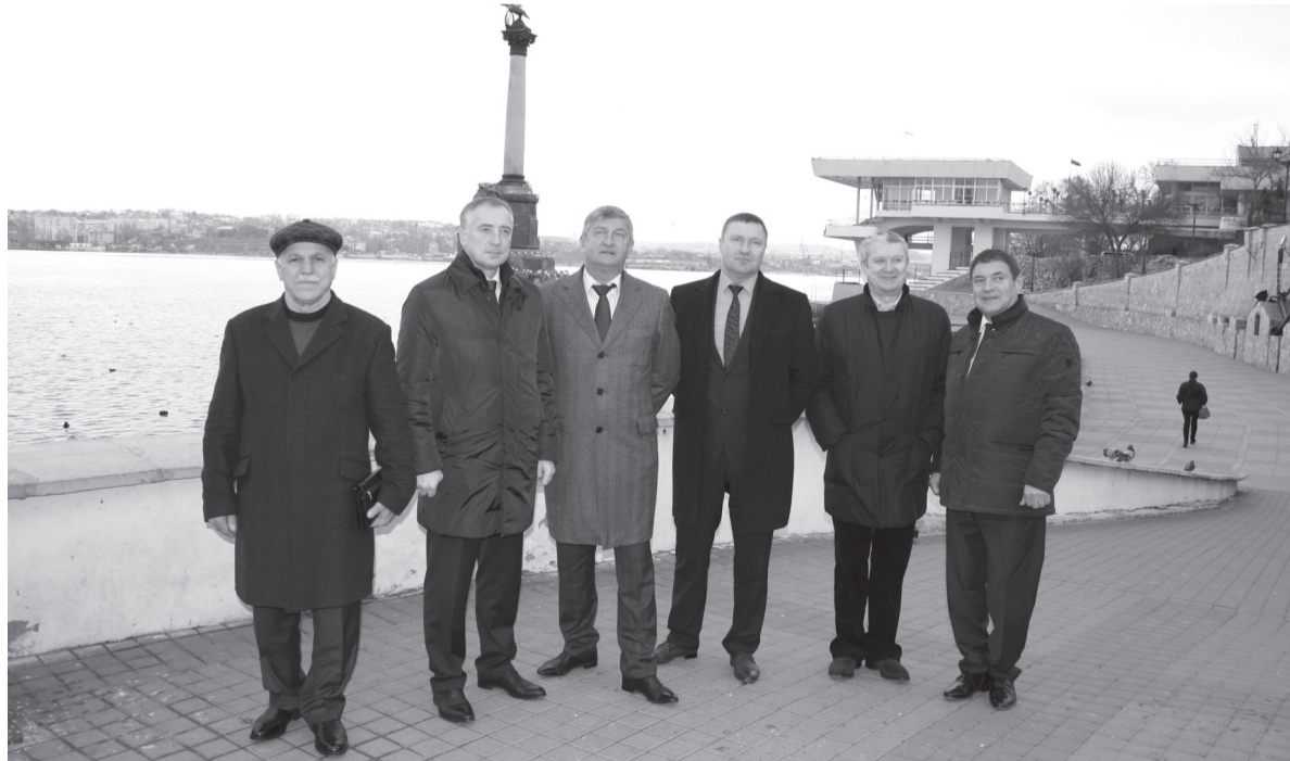
Тобольская делегация в г. Сакхи (Республика Крым)

6 марта власти Автономной Республики Крым и Севастополя объявили о переносе референдума на 16 марта 2014 года. На голосование поставлено два вопроса: «Вы за воссоединение Крыма с Россией на правах субъекта Российской Федерации?» и «Вы за восстановление действия конституции Республики Крым 1992 года и за статус Крыма как части Украины?»