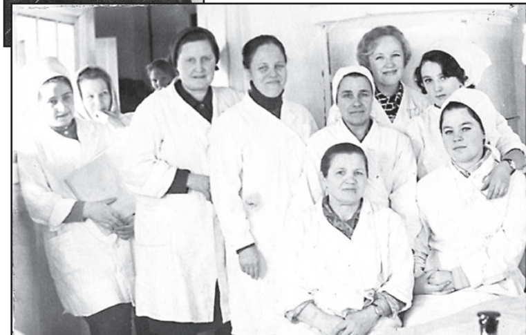
Работа в аптеке – часть трудовой биографии

так много воспоминаний военных лет – детская память, хотя и цепкая, но проходящая. Единственное, что собеседница отмечает, – это безрадостность пережитого. Чудом выжили, считает она.