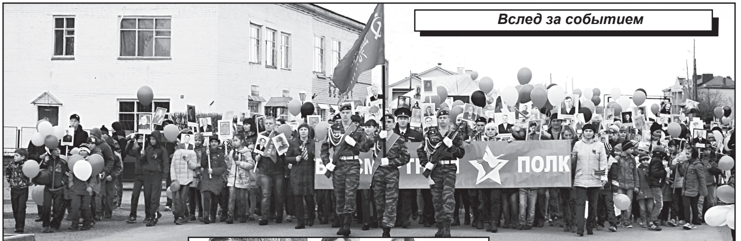
Вслед за событием

Строгие, скорбные, торжественные мотивы концертов в день великого праздника 9 Мая, у которого нет срока давности. Как семьдесят, как пятьдесят, как двадцать лет назад. Уникальный, всеобщий – наш праздник, важный для всех и каждого, «величественность которого определил сам народ».