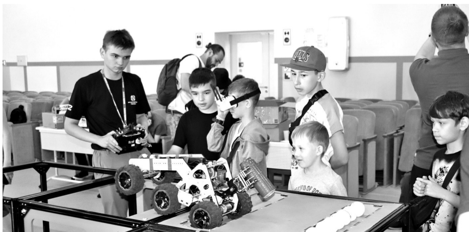
• Трасса «Кубка РТК» была очень сложной. Но умные машины, сделанные школьниками нашей области, преодолевали полосу препятствий с блеском.