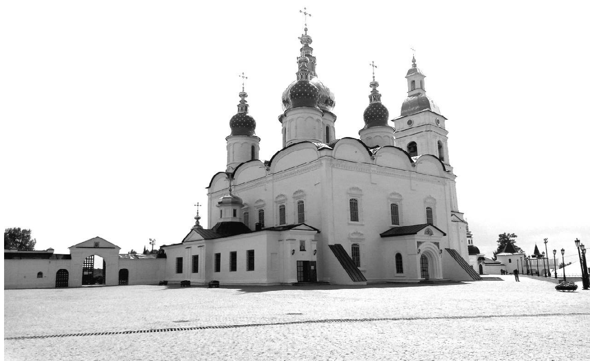
» Софийско-Успенский собор