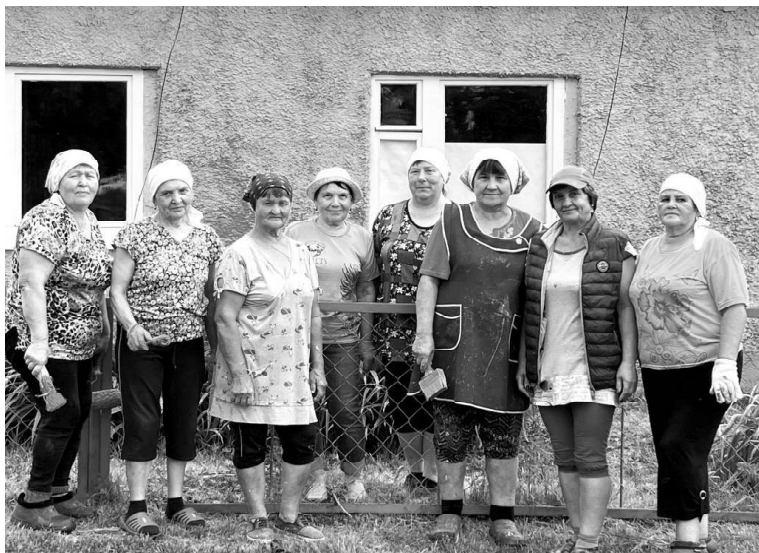
➤ Пенсионеры с. Нововяткино

В этот день работали Г. Вохмин – депутат Викуловской рай-