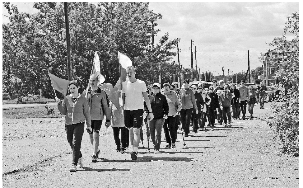
➤ Акция в Викулово