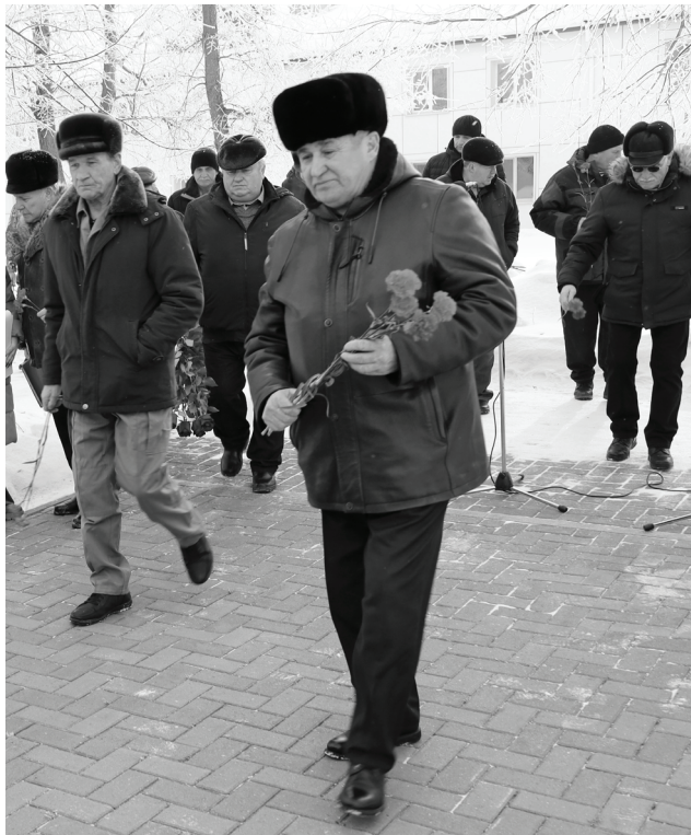
Воины-интернационалисты внесли значимый вклад в укрепление славных традиций Российской армии.

В Сладковском районе прошёл митинг, посвящённый Дню памяти воинов-интернационалистов и 36-летней годовщине со дня вывода советских войск из Афганистана.