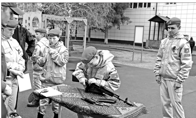
■ Собирают и разбирают автомат Калашникова – умение не из лёгких.

Во время игры школьники не только смогли показать свою физическую подготовку, но и проявить командный дух, работу в непредвиденных обстоятельствах, стремление к результату. В исторической викторине, к примеру, школьники продемонстрировали свои знания о погранич-