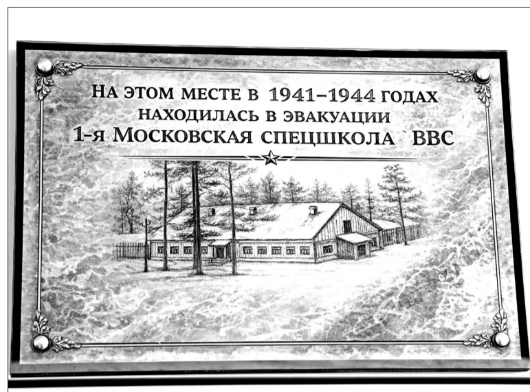
■ Вот такая мемориальная доска, посвящённая 1-й Московской спецшколе ВВС, установлена на фасаде спортивного комплекса «Жемчужина юрского моря».