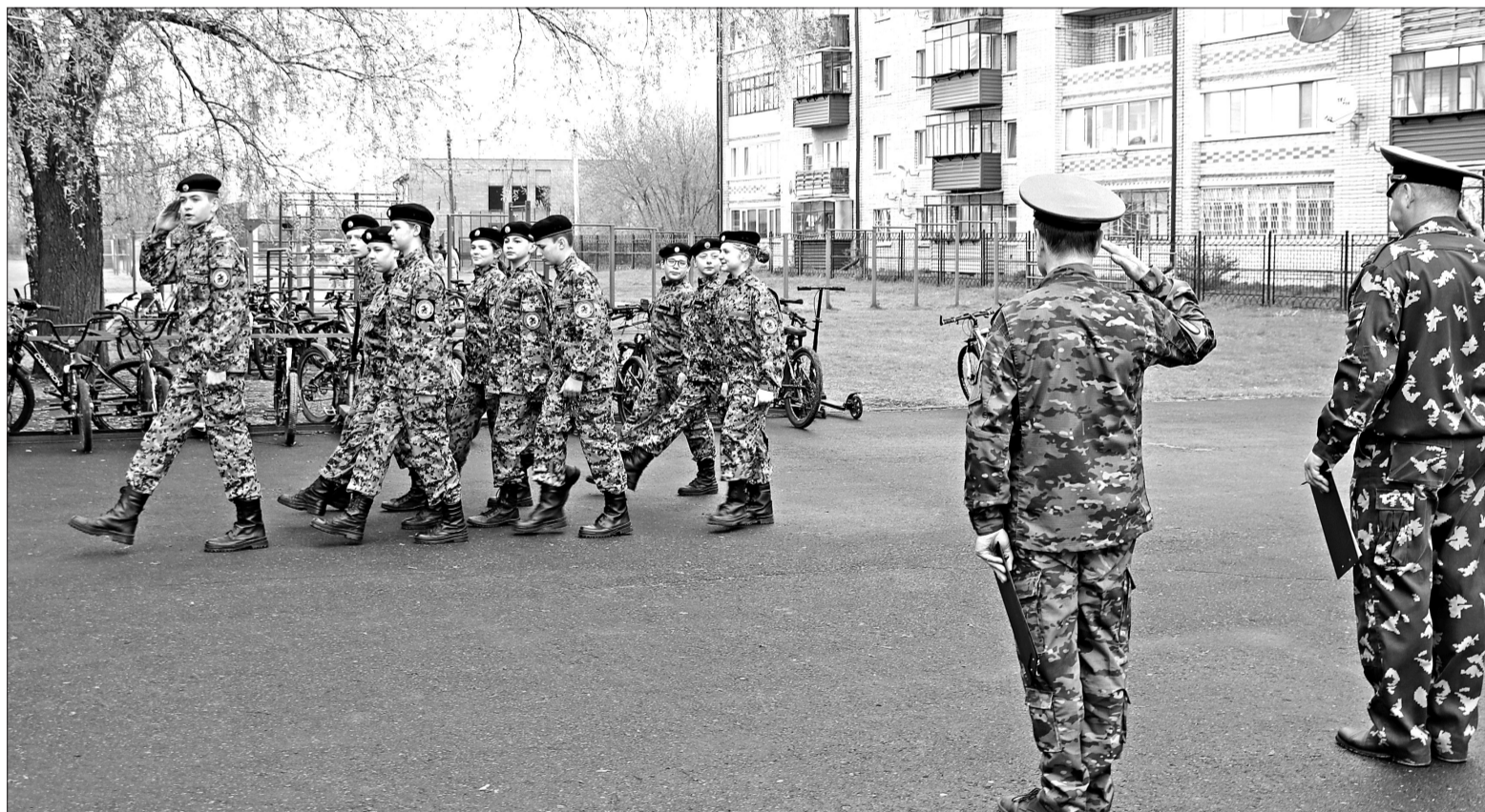
■ На плацу участники строевого смотра военно-спортивной игры «Граница-2026».

Патриотическое воспитание. Заводоуковские школьники выясняли, кто сплочённее в военно-спортивной игре