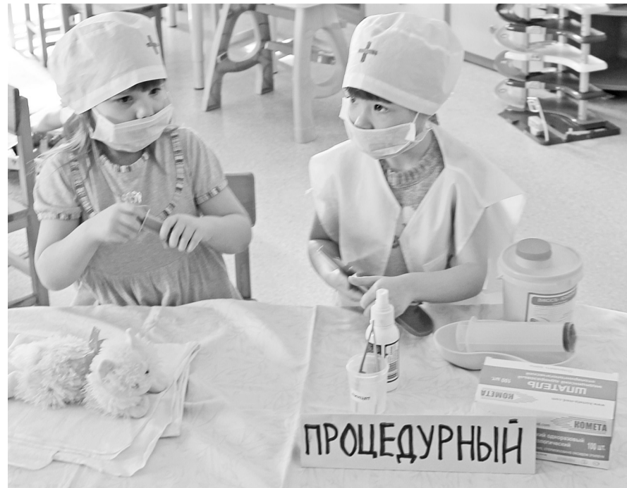
Заняты серьёзным делом.

Причём ребяташки не просто играют – они «проживают» определённую