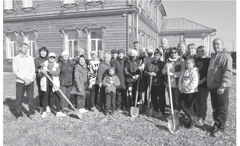
Заряд бодрости и хорошего настроения получили все участники встречи

После трапезы и чая из самовара на углях ребята из Покровского филиала Ярковской детской музыкальной школы показали для