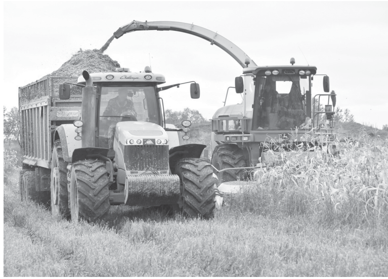
Уборка кукурузы в «Междуречье» идет полным ходом

«Изначально силос являлся молокогонным кормом для коров. Отказываться от него начали по двум причинам. Во-первых, из-за недозревания он не имел высокой калорийности, что сказывалось на качестве молока. Во-вторых, из-за ошибок в технологии заготовки молоко получалось со специфическим запахом, который на молзаводах не могли удалить. Над этой проблемой специалисты АПК серьезно поработали. Новые технологии позволяют получить силос с высокими показателями по калорийности, также у него минимизирована кислотность, и