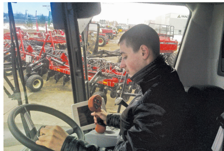
Новые технологии требуют молодых энергичных кадров.