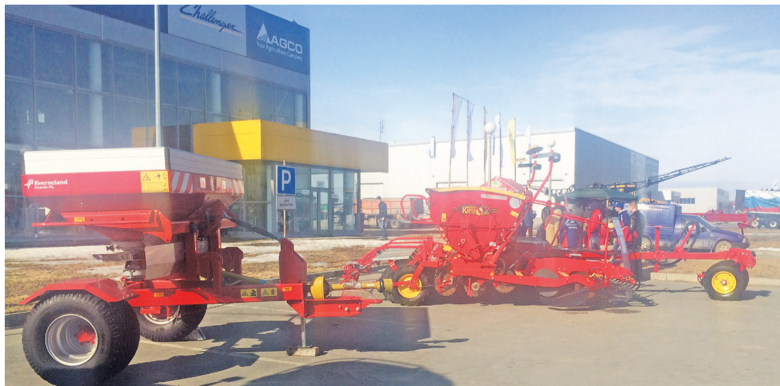
Чего только нет на этом сегменте выставки.