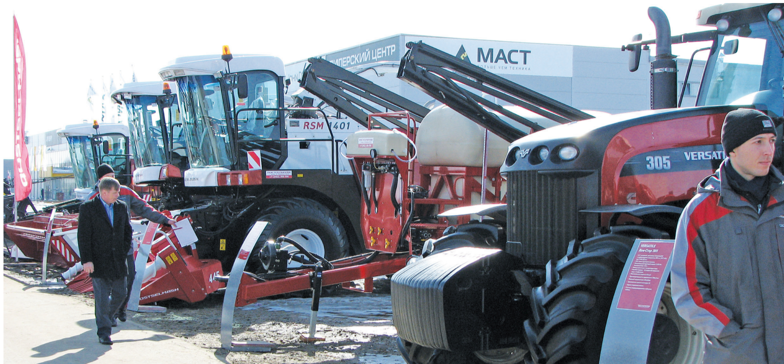
И того хочется, и этот трактор в хозяйство вписывается, а цена кусается.

А посмотреть на выставку было действительно на что: трактора самых различных марок и назначения, зерноубороч-