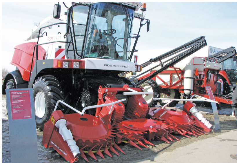
А это новый комбайн.