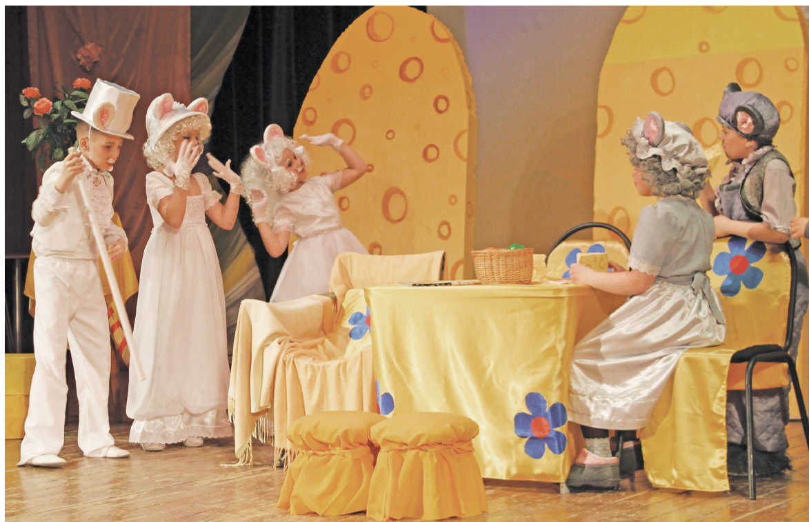
Встреча двух мышиных семейств.