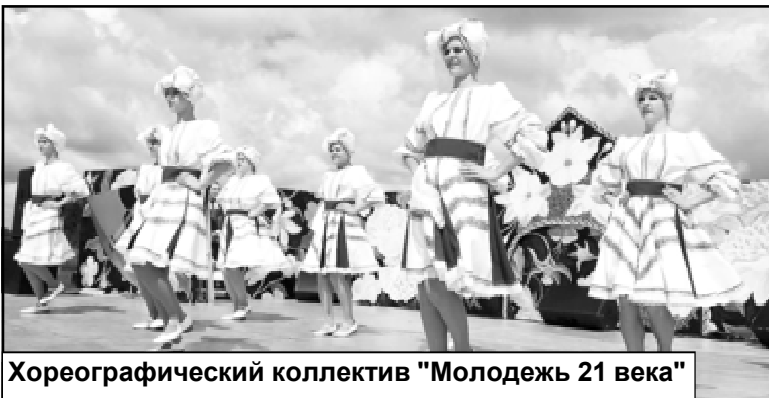
Хореографический коллектив "Молодежь 21 века"