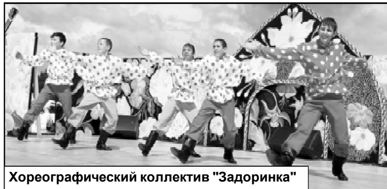
Хореографический коллектив "Задоринка"