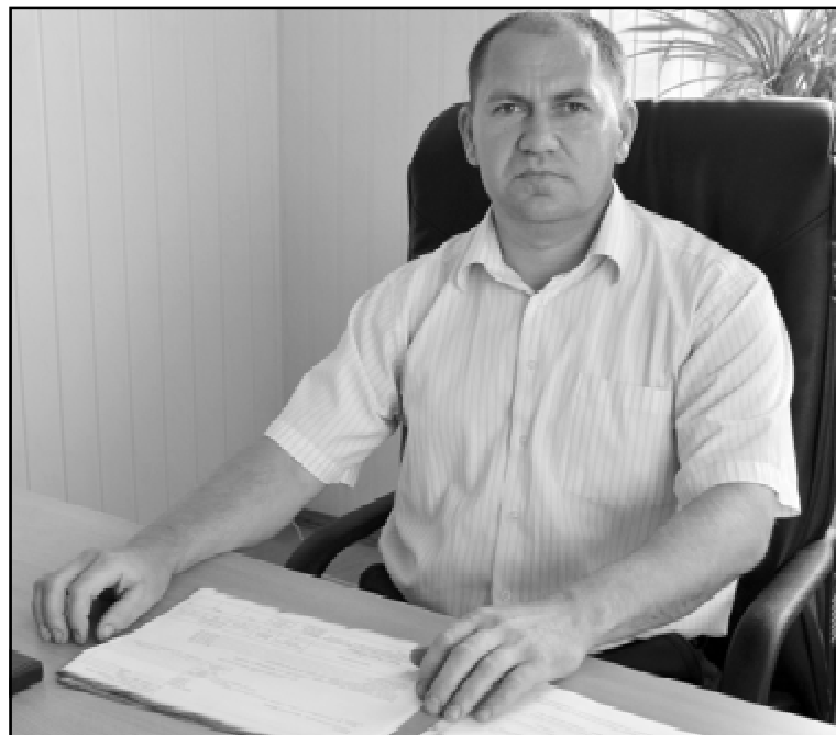
Материалы подготовила Лариса ЛАПУХИНА

- Успехов. Надеюсь, что это не последняя наша встреча.