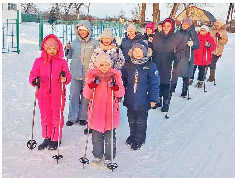
Зимний поход любителей скандинавской ходьбы в Гагарье

6 января мужская волейбольная команда Казанского округа приняла участие в десятом Рождественском турнире, который проходил в селе Гагарино Ишимского округа. По резуль-