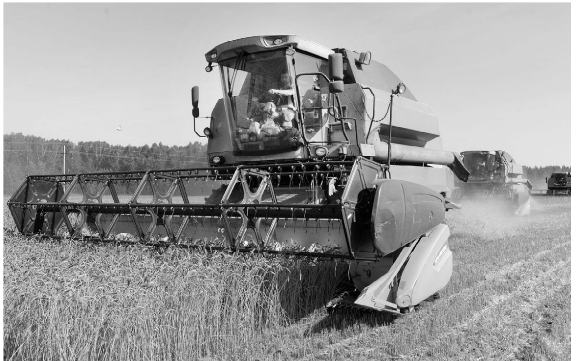
Аграрии района продолжают уборку полей, используя каждый погожий час

По данным управления развития АПК, на 14 сентября уровень выполнения уборки составил 30,6 процента.