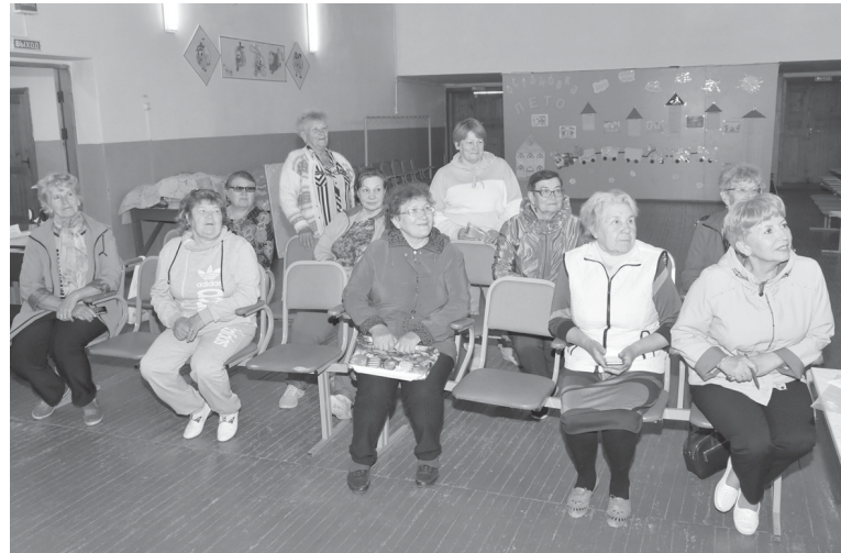
На занятиях «Университета третьего возраста»

- У нас действует школа волонтерского мастерства, являющаяся местным филиалом областной штаб-квартиры «Серебряного добровольчества». На этих занятиях мы знакомим по-