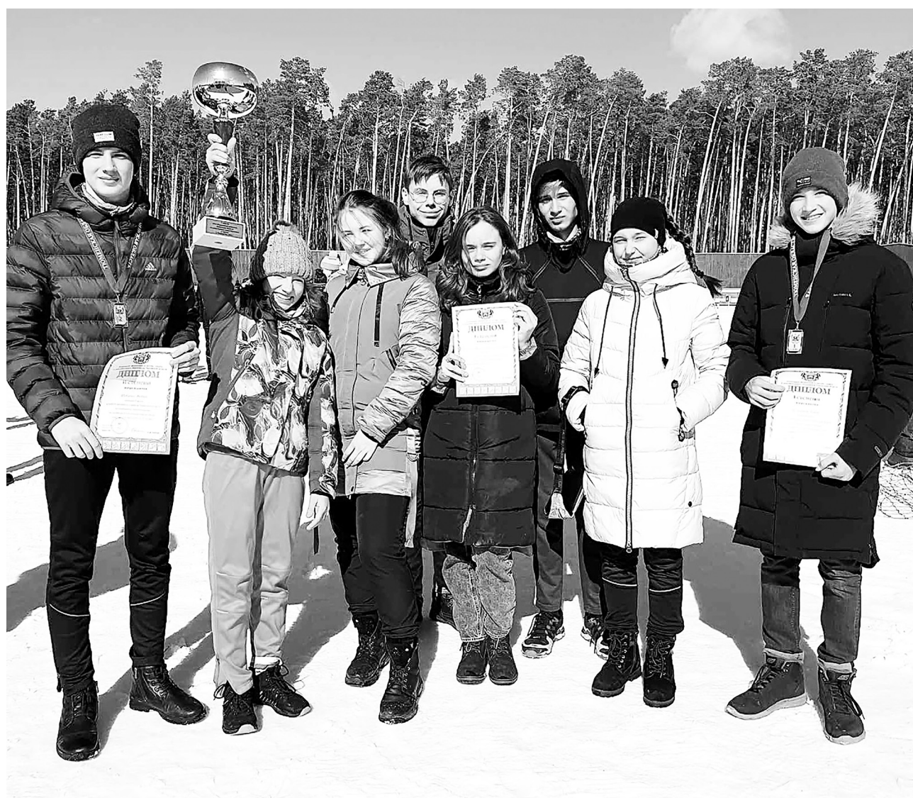
Сборная команда Нижнетавдинского района по ориентированию на лыжах в Заводоуковске.

Нижнетавдинские школьники показали высший пилотаж в ориентировании на лыжах