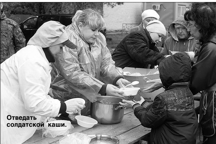
Отведать солдатской каши.