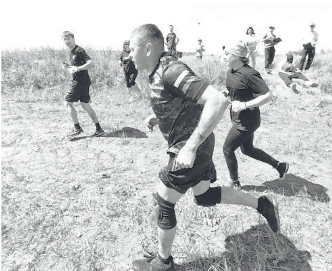
Участники забега по трассе между препятствиями стараются двигаться максимально быстро.

Особую трудность вызвал «Эверест» – высокое препятствие, которое покрыто гладким синтетическим материалом. По