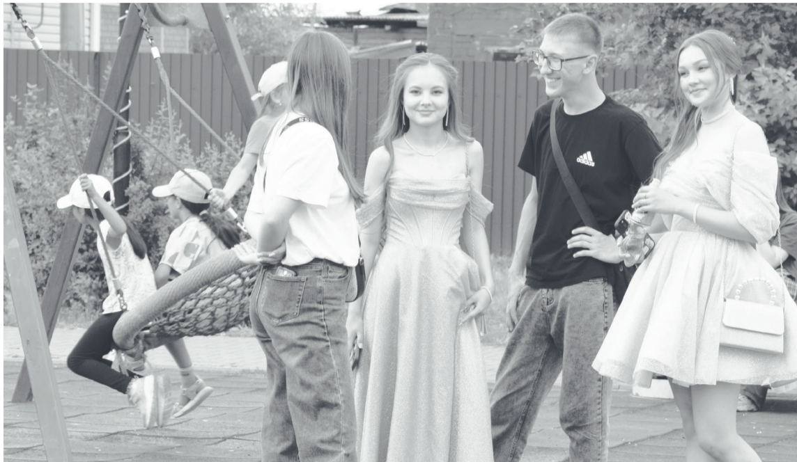
Мероприятие посетили выпускники Упоровской школы.

После торжественной части был дан старт праздничному концерту. Артисты подарили зрителям настоящее музыкальное путешествие, исполнив попури из хитов разных лет. Каждый номер зрители встре-