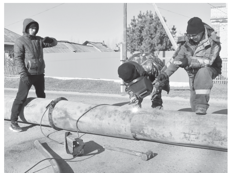
Скоро на улице Новоселов будет уложена водопропускная труба