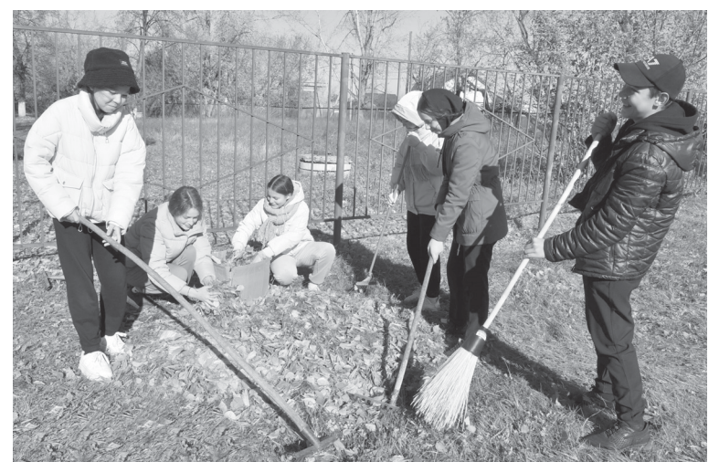
Для юных дубровинцев минувшая пятница прошла на свежем воздухе