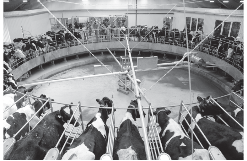
Валовой сбор молока в районе

Пару слов о том, как обстоят дела в животноводстве в России и мире в целом. Судя по отечественным показателям, до пика молочного производства, достигнутого в стране в конце восьмидесятых годов прошлого столетия, еще далеко. Не растут пока в России в целом ни поголовье дойного стада, ни валовой сбор молока. С другой стороны, это