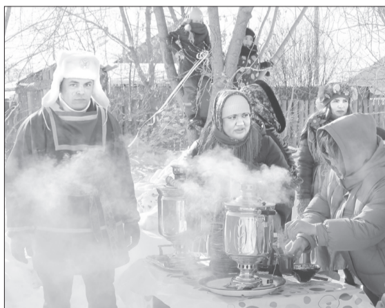
Чай из самоваров на дровах - настоящая сельская экзотика

■ СПРАВКА «ЯЖ». Прогресс входит в состав Памятинского сельского поселения.