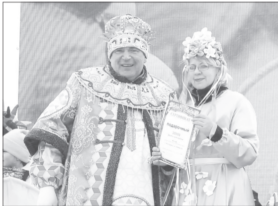
Из рук блинного царя победители и призёры конкурсов получили денежные призы и подарки от партнёров праздника – тюменских производителей