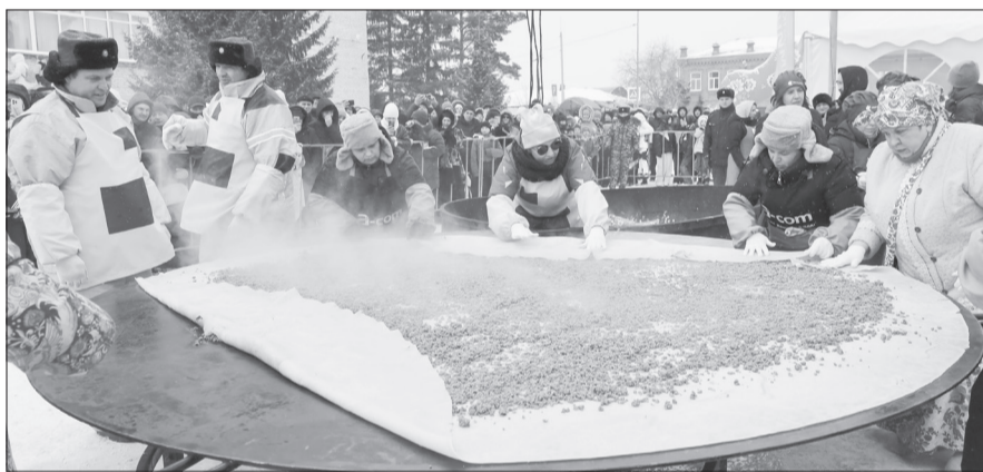
В этом году блинопёки решили провести эксперимент и зафаршировали в трёхметровый мясную начинку