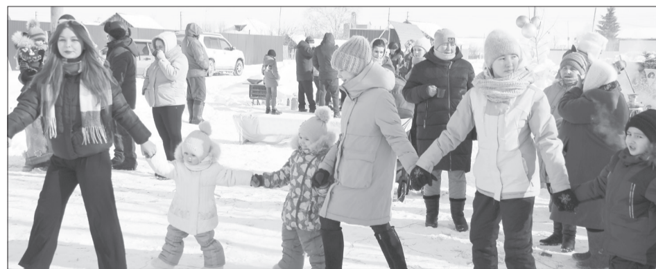
Особенно радовались празднику дети

- Вначале сложились по 200 рублей со двора, купили игровые призы ребятишкам. А даль-