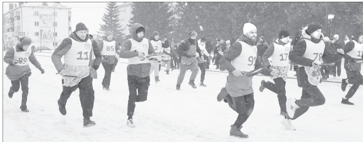
В забеге «Блин, беги» участвовали две команды: мужская и женская

В блинной столице России отметили Масленицу