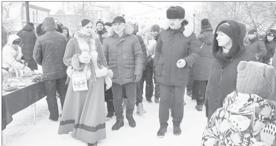
Губернатор Тюменской области Александр Моор прогулялся по праздничным локациям и посетил ялуторовский острог