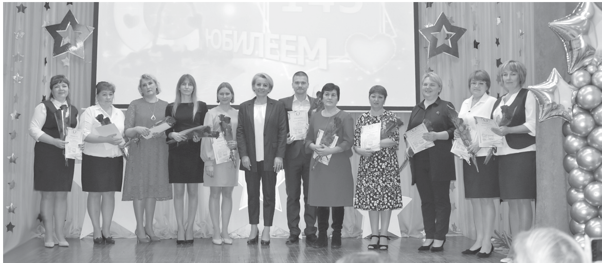
Педагоги и сотрудники школы, отмеченные грамотами за многолетний добросовестный труд