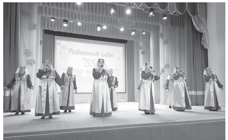
На сцене Ярковского Центра культуры и досуга

культуры «Сабантуй», где не только принимает участие в праздничном концерте, но и представляет гостям национальное подворье и блюда национальной кухни. Ансамбль является неоднократным лауреатом и дипломантом смотров-конкурсов народного творчества.