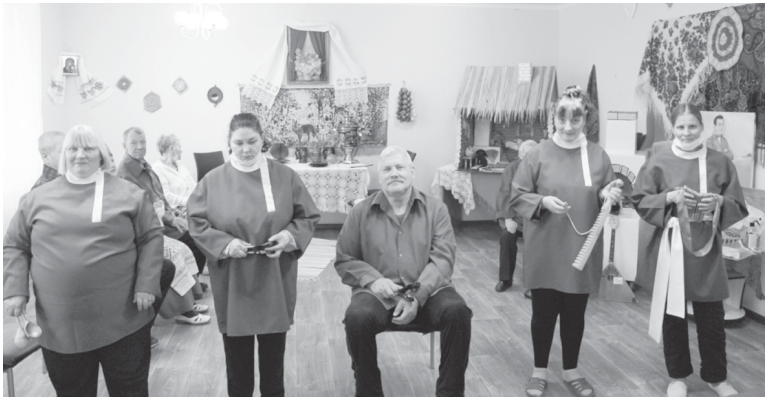
Шумовой оркестр «Коробейники»

Завершился одиннадцатый областной фестиваль творчества пожилых и маломобильных людей, проживающих в стационарных учреждениях социального обслуживания населения Тюменской области «Крылья души». Мероприятие организовано Ассоциацией организаций социального обслуживания населения Тюменской области при поддержке Департамента социального развития Тюменской области и Регионального центра активного долголетия, геронтологии и реабилитации. Цель проведения – повышение уровня социализации людей пожилого возраста и инвалидов, а также выявление одарённых граждан с ограниченными возможностями и развитие их творческого потенциала. Тема нынешнего сезона – «Культурные традиции народов мира».