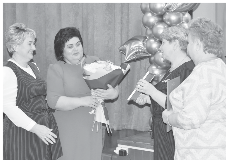
Поздравление от коллег – заведующих филиалов Ярковской школы

системе образования, профессиональное мастерство, значимый вклад в развитие учебно-воспитательного процесса и в честь юбилея школы заместителям директора по учебно-воспи-