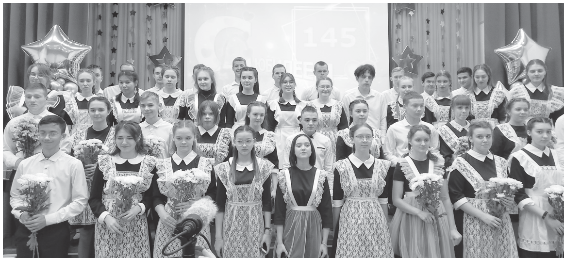
Песня в подарок ветеранам от учащихся Ярковской школы

В этот вечер прозвучало ещё много тёплых слов. Так пусть же сбудутся пожелания, которые были адресованы в этот день «юбиляру». Живи и процветай, наша родная школа!