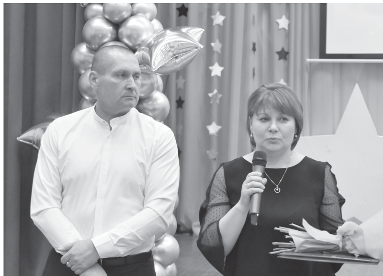
Бывшие выпускники, директора муниципальных учреждений, поздравили школу с юбилеем