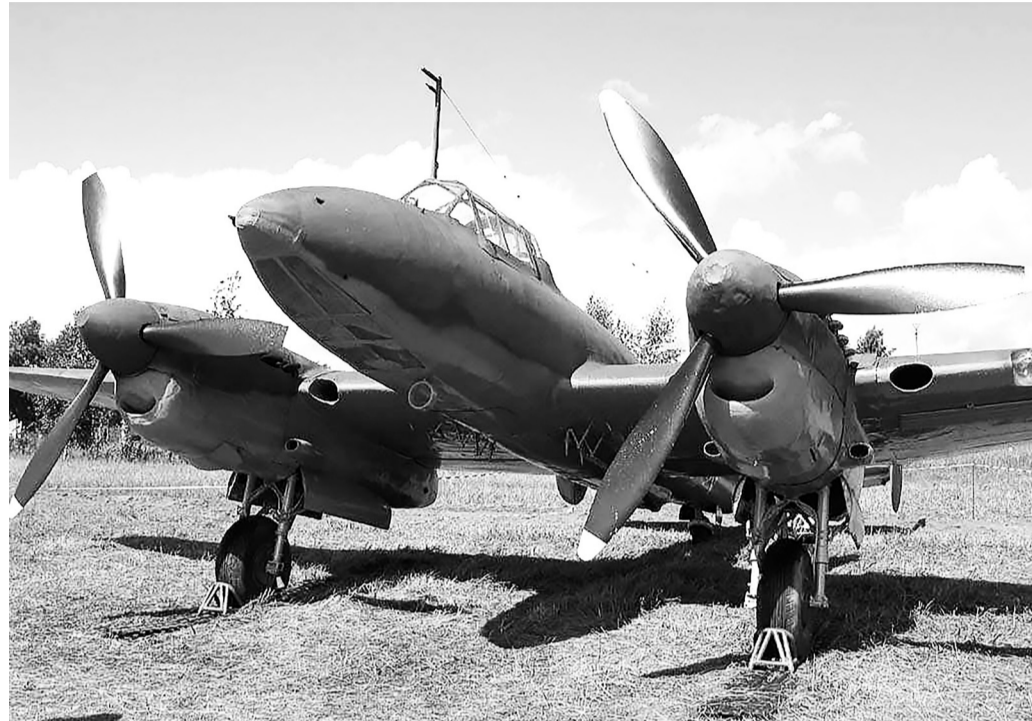
Так выглядят «пешки» – пикирующие бомбардировщики Пе-2; находясь на борту аналогичного в неравном бою погиб наш земляк.

стали заходить в хвост нашей девятки с правого и левого флангов. Первая группа произвела атаку в лоб и ушла под строй девятки с последующим выходом для атаки сверху сзади. Истребители прикрытия были отсечены истребителями противника. Атаки истребителями противника производились замкнутым кольцом, в силу чего звенья были разбиты, строй нарушен, а также была нарушена система огня. В результате тяжёлого неравного боя наши потери – 6 самолётов Пе-2. Потери противника – 5 истребителей...»