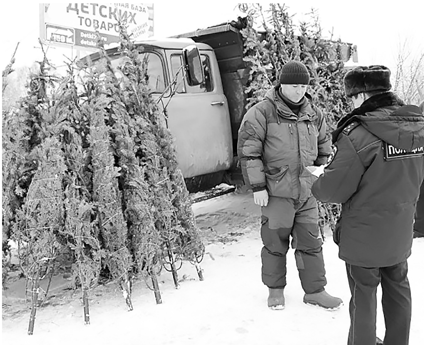
Патрули лесников и полиции будут останавливать нарушителей и подвергать их административному наказанию.