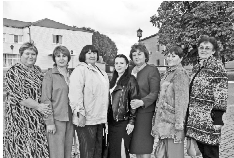
➤ Делегация Поддубровинской школы