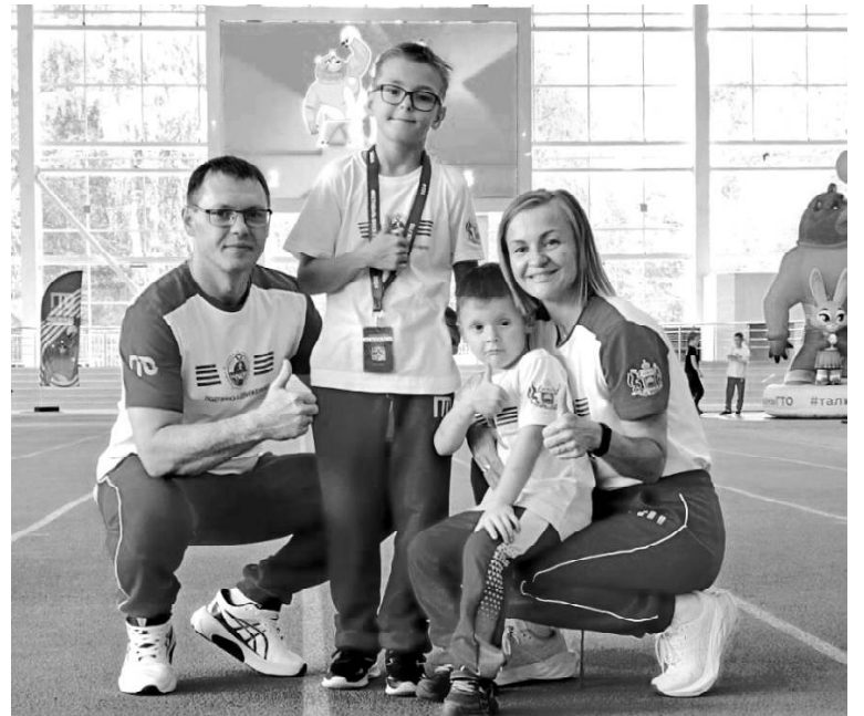
► Семья Шубиных в Томске

• 31 августа – День ветеринарного работника