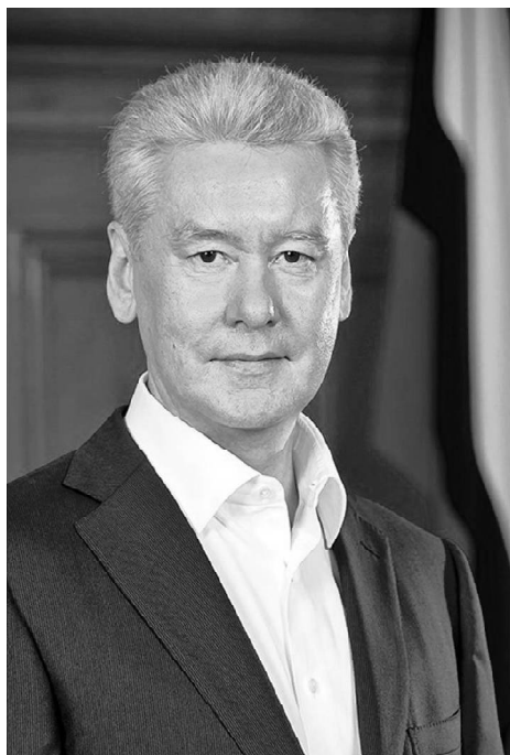
➤ Сергей Семёнович Собянин