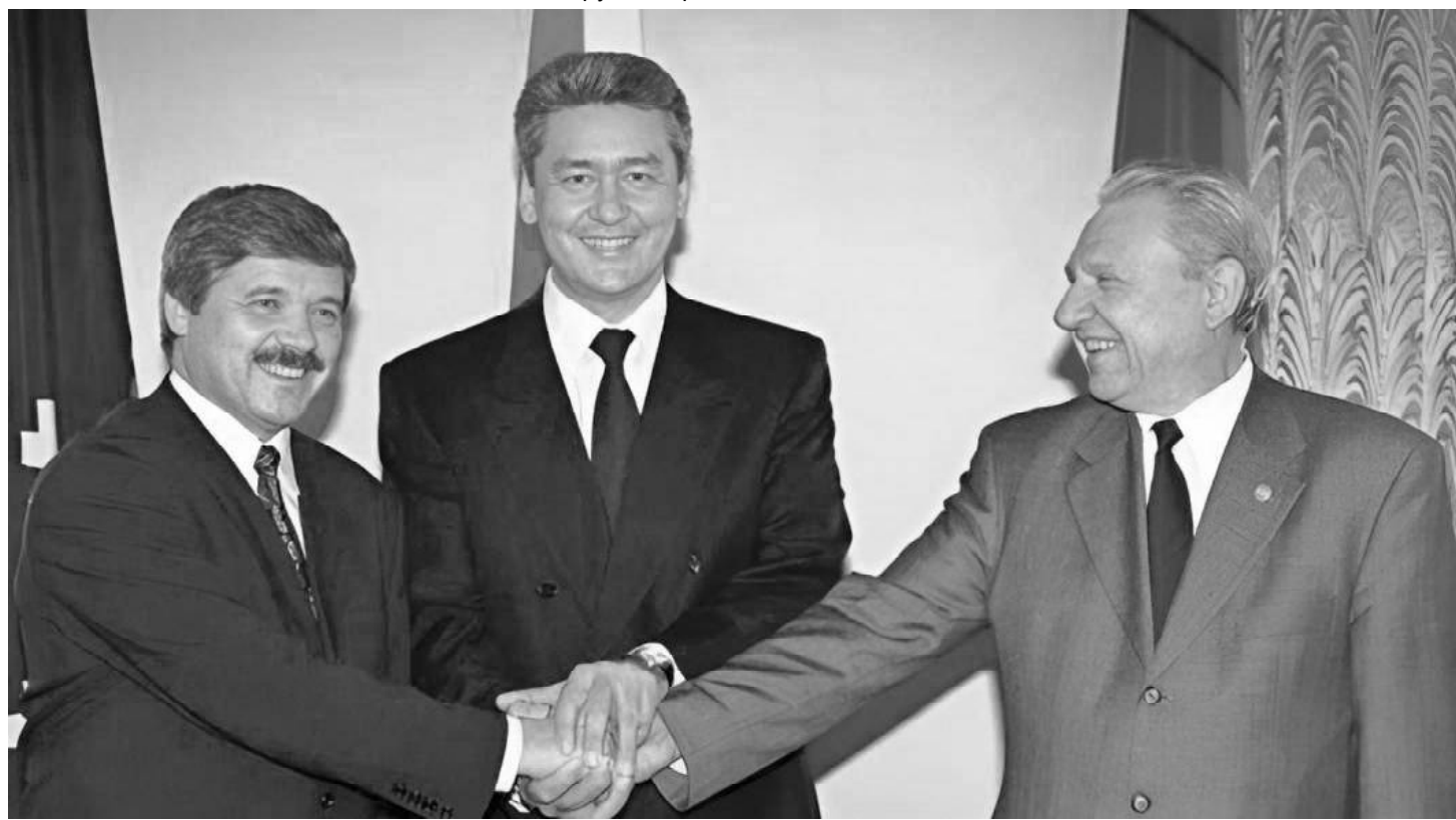
➤ Юрий Неёлов, Сергей Собянин, Александр Филипенко, 2005 г.