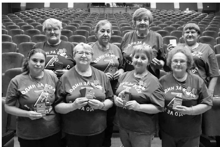
Участницы вагайской группы добровольцев «Один за всех, все за одного» отмечены медалями «За помощь фронту» в знак благодарности от военнослужащих города Луганска

Программа концерта была пронизана чувством глубокого патриотизма. Ее эпизоды были посвящены любви к Родине, подвигам солдат Великой Отечественной войны, героям спецоперации и других локальных конфликтов, труженикам мирных профессий и родителям, воспитавших достойных граждан своей страны.