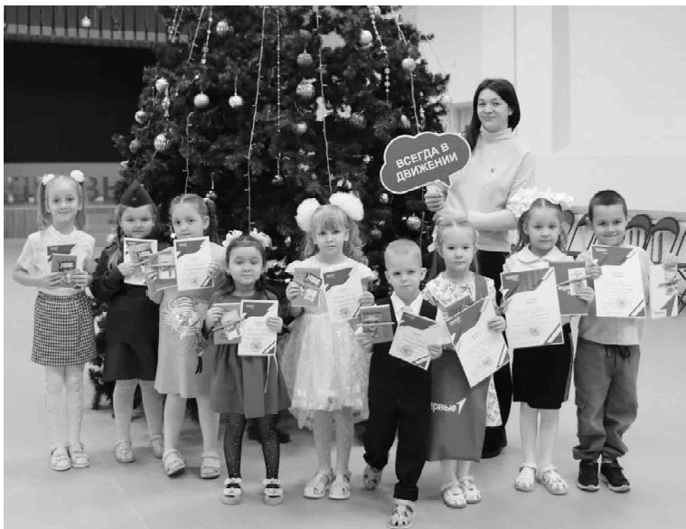
Самые юные участники конференции рады наградам

Учащиеся 6 - 8 классов порадовали жюри выразительными