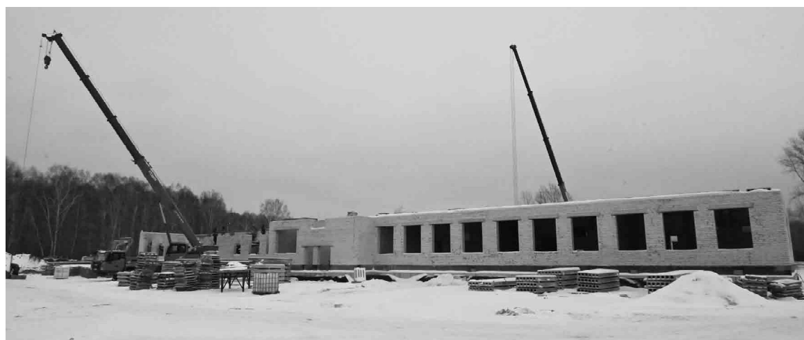
Строительство общеобразовательной школы в Ситниково началось в марте этого года. Подрядная организация планирует завершить работу на объекте в 2027-м