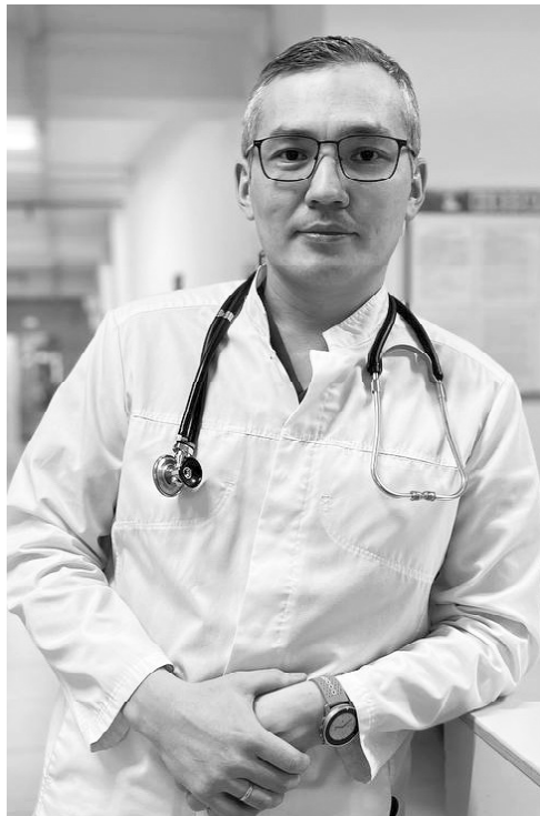
➤ Арман Женатов