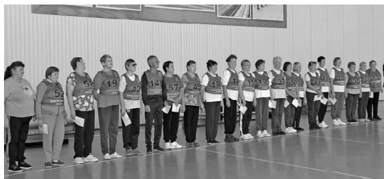
➤ На построении

В спортивном зале ДЮСШ «Спринт» — активные представители первичек ветеранских организаций района и председатели. А поводом собраться и испытать себя стала акция «Долголетие по-тюменски», которая проходит в рамках проекта «За здоровый образ жизни».