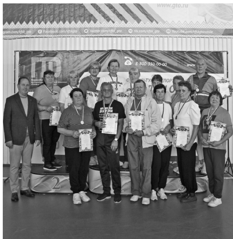
➤ Лидеры фестиваля «Долголетие по-тюменски»