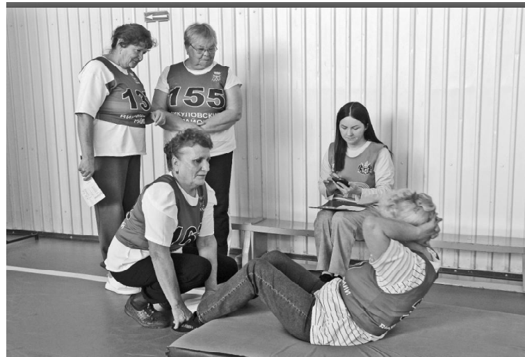
➤ Проходя этапы соревнований