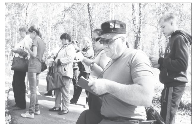
Над ответами приходится задумываться даже опытным спортсменам.