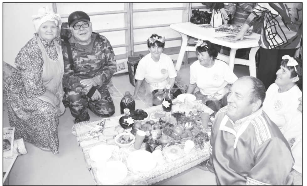
Победители номинации «Обед на привале» – ветераны из Липихи.

дал самый любимый и аппетитный конкурс для туристов любого возраста – «Обед на привале». Вот тут-то хозяйки души свою отдали! Пирожки и плюшки, булочки и блинчики, каши и супы, закуски и бутерброды, запеканки и кулебяки, огурчики и помидорчики, компоты, морсы, чай и квасы. Жюри пришлось непросто, но лучшим был назван привал липихинцев, которые накрыли колоритную «поляну» прямо на «земле» рядом с «костерком» и даже со своим охотником.