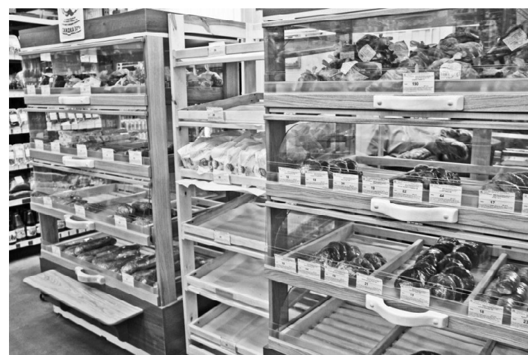
► Витрина с выпечкой

– Каждый день у нас на прилавке – свежая выпечка. Ассортимент широкий: 40 наименований булочек, 5 – бутербродов, 6 видов хлеба, 3 – батона, — делится Нина Ашарина, управляющая магазином «Низкоцен». — Булочки меняем каждую смену: 20 в одну и 20 в следующую, кроме выпечки, жарим кур. В день расходуется от 10 до 20 килограммов, а в празднич-