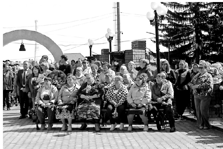
➤ На митинге в Викулово