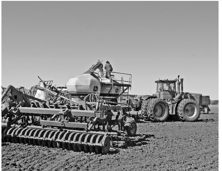
➤ Посевная в ООО «Радиус-агро»

Посевная-2026 складывается для викуловских аграриев благоприятно. Об этом свидетельствуют достигнутые показатели.