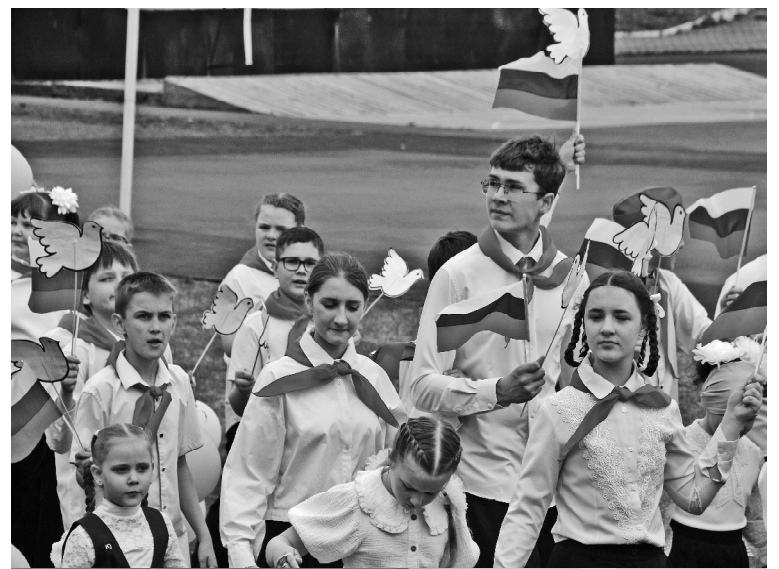
Моменты празднования 1 мая в Викулово