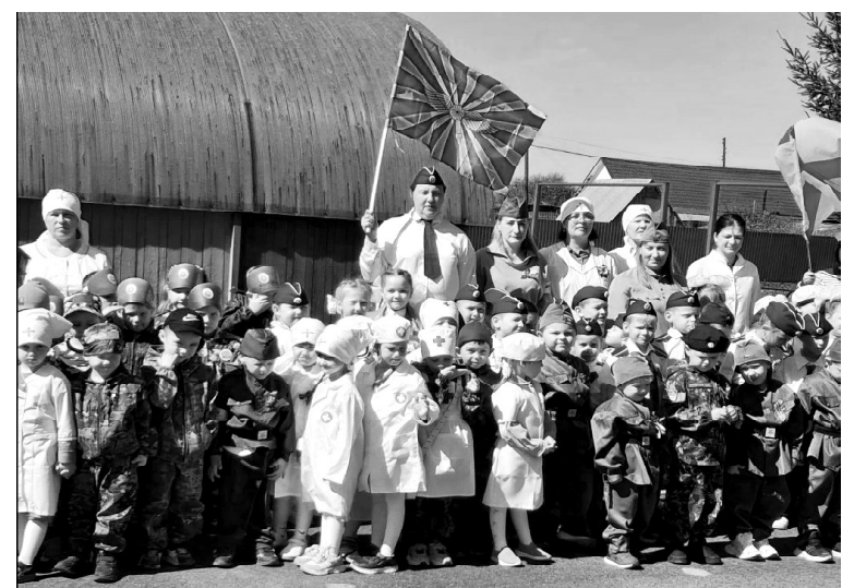
➤ «Парад дошколят» в Дельфине