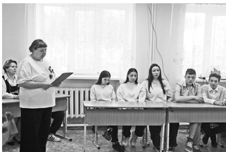
➤ На уроке мужества