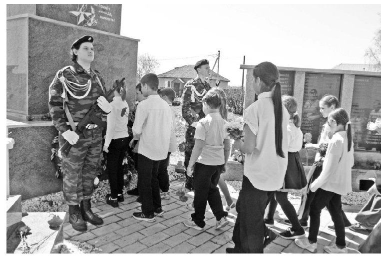
➤ Возложение цветов к мемориалу // Фото Татьяны СУХОВОЙ