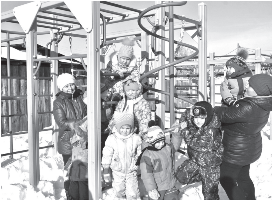
• Новая детская площадка на радость сотне мальчишек и девчонок. Именно столько ребятшек сегодня в Озерках.

Ребятишкам из Озерков теперь есть где порезвиться: буквально недели две назад здесь близ детского сада установили большой игровой спортивный комплекс.