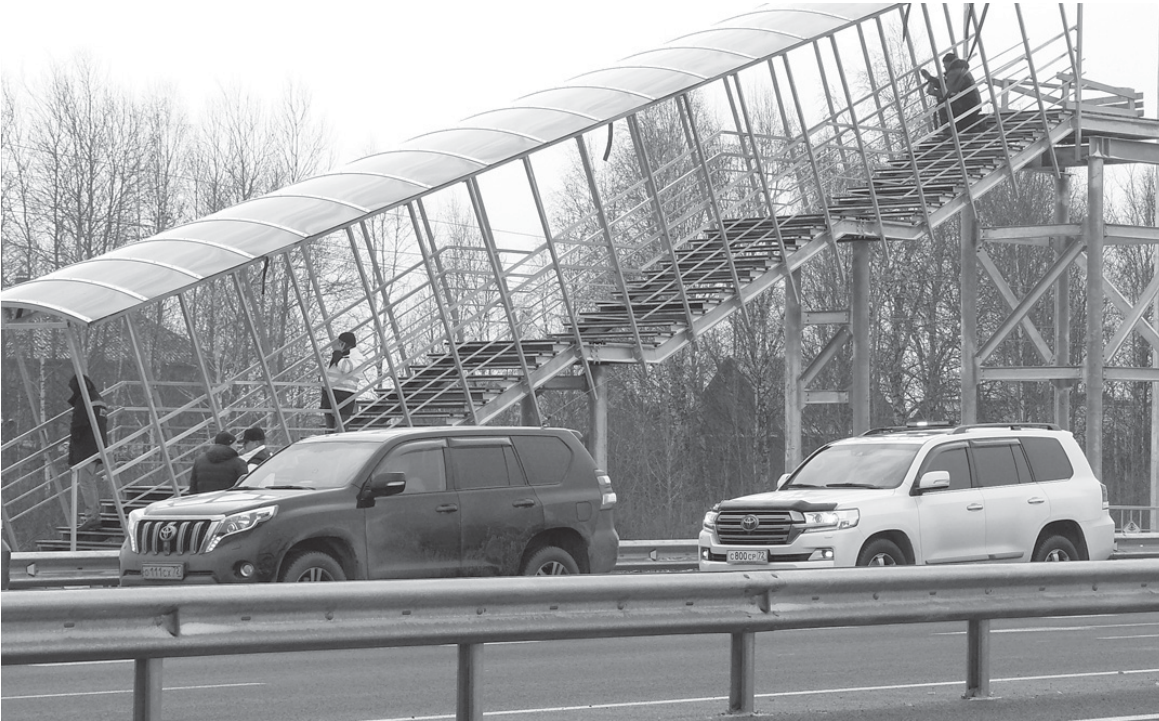
Монтажные работы на переходе подходят к завершению

Вблизи Ярково начался монтаж надземного пешеходного перехода через федеральную автотрассу Тюмень – Ханты-Мансийск. Сооружение свяжет райцентр с одним из отдаленных ярковских «микрорайонов» – поселком Молодежный. В настоящее время с улицы Дзержинского до перехода сделан тротуар, практически смонтированы лестничные пролеты, изготовлено и доставлено к месту установки пролетное строение.