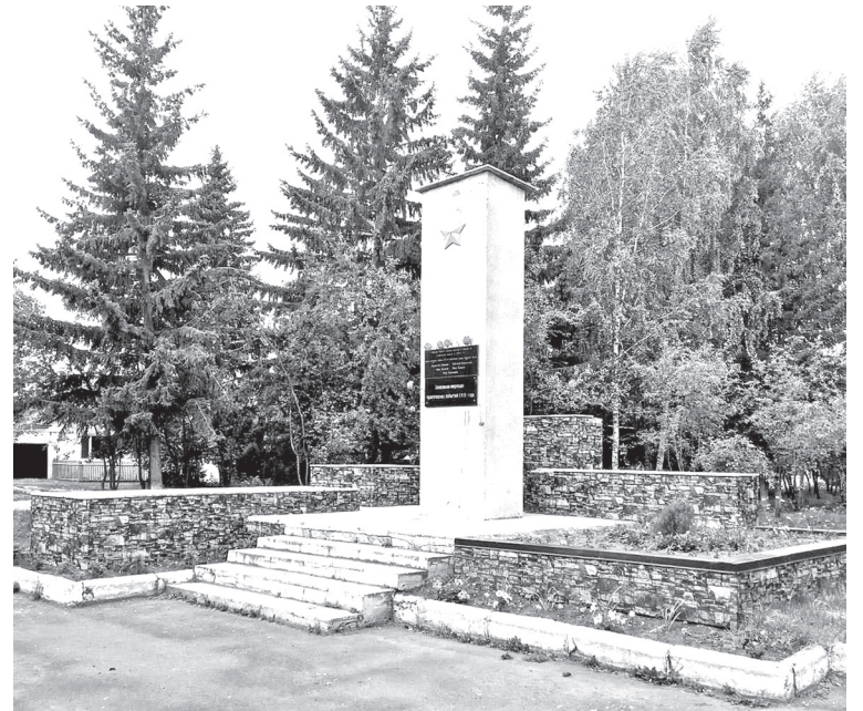
• Почти 40 лет назад захоронение красноармейцев 253-го стрелкового полка «Красные орлы» перенесли на улицу Свободы в городе.