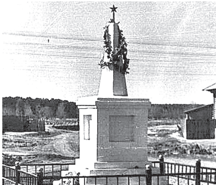
• Этот обелиск находился когда-то в историческом центре села Заводоуковского.

Татьяна ВОЕВОДИНА Фото автора и из архива Заводоуковского краеведческого музея