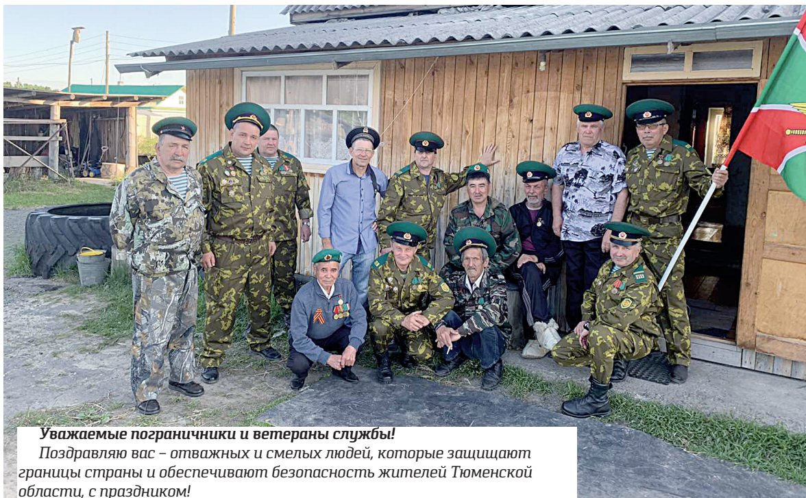
Уважаемые пограничники и ветераны службы!

Поздравляю вас – отважных и смелых людей, которые защищают границы страны и обеспечивают безопасность жителей Тюменской области, с праздником!