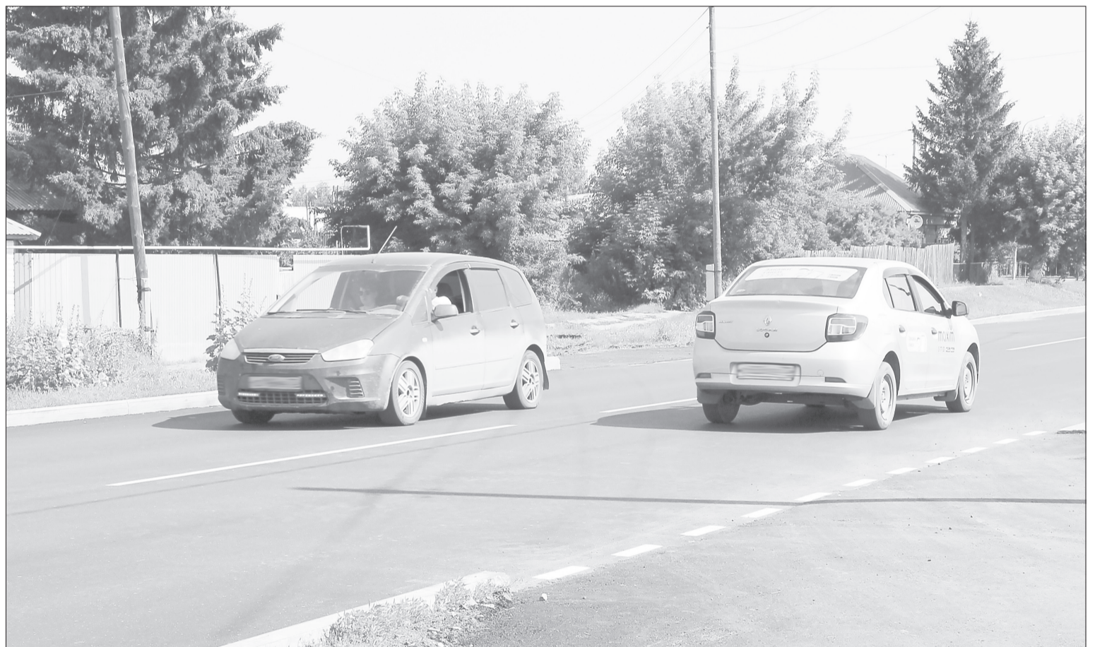
Железнодорожные пути, пересекавшие ул. Красноармейскую, демонтировали во время замены дорожного полотна

Горожане ждут сквозной проезд на месте ликвидированной ветки