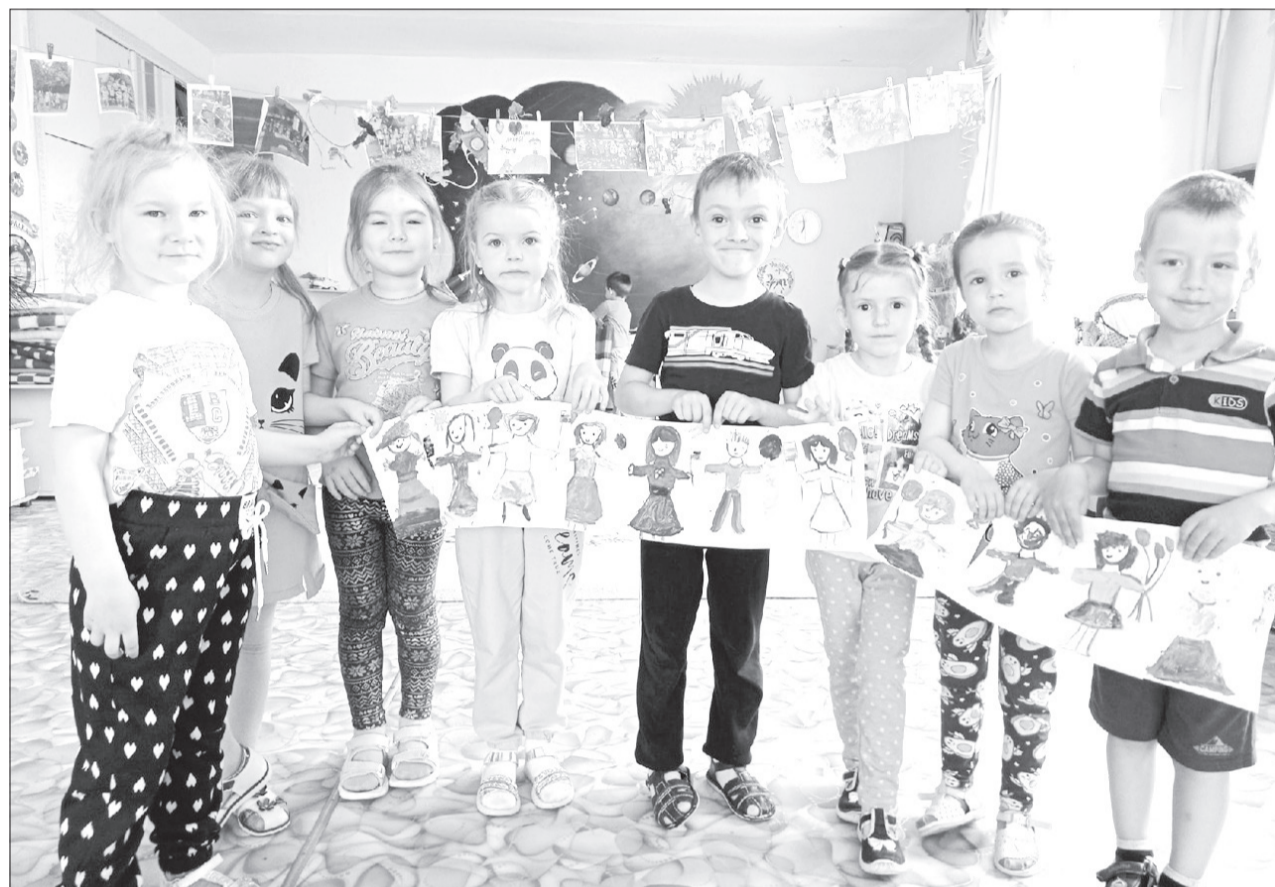
Быть художником-портретистом непросто, но очень занимательно

Для ялуторовских малышей провели неделю Дельфийских игр