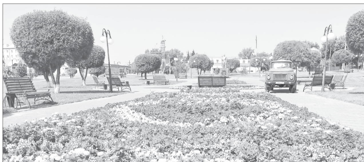
После звонка местных жителей в сквере ветеранов лесозавода навели порядок

Горожане ждут сквозной проезд на месте ликвидированной ветки