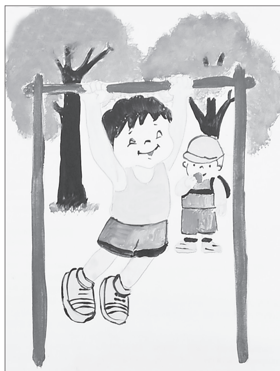
Здоровье и духа бодрость - наша большая гордость!

Детские рисунки уже отправлены на областной этап конкурса, в котором ялуторовчане неоднократно становились призёрами. Его итоги будут известны в сентябре.