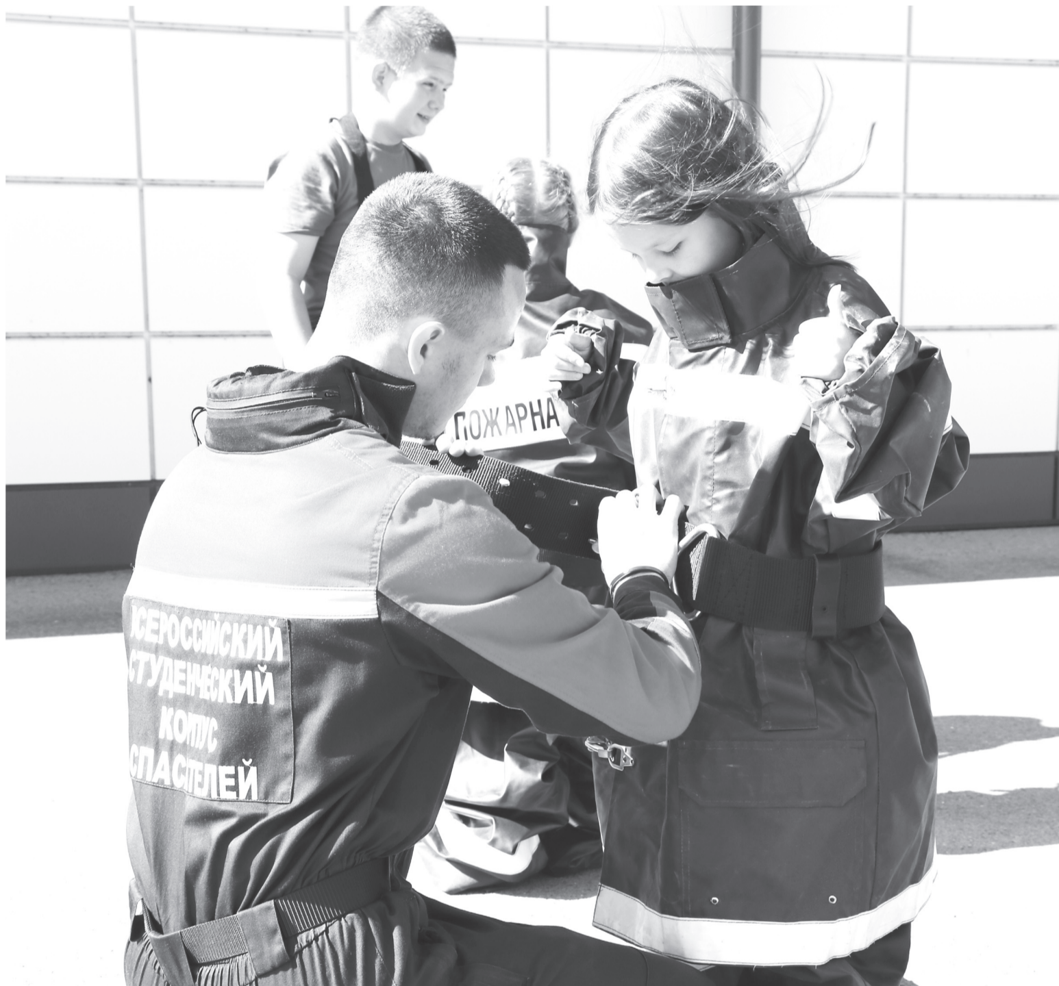
|| Во время занятий ребята примерили обмундирование пожарного.