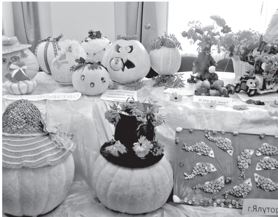
• «Тыквенный маскарад» от юннатов из Ялуторовска.

Конкурс «Юннат-2015» собрал порядка полутора сотен школьников из всех районов юга области. Юные натуралисты из Заводоуковска тоже не остались в стороне и привезли на профильную выставку в Тюмень свои рукотворные работы.