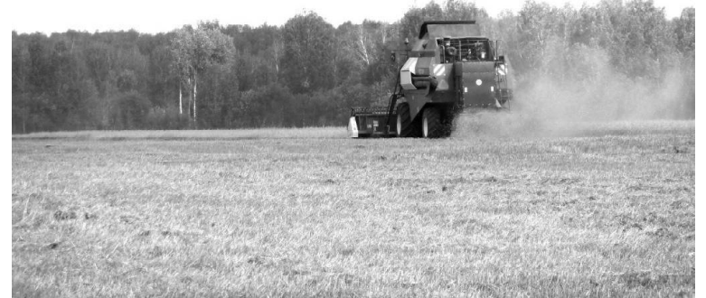
Комбайн в поле