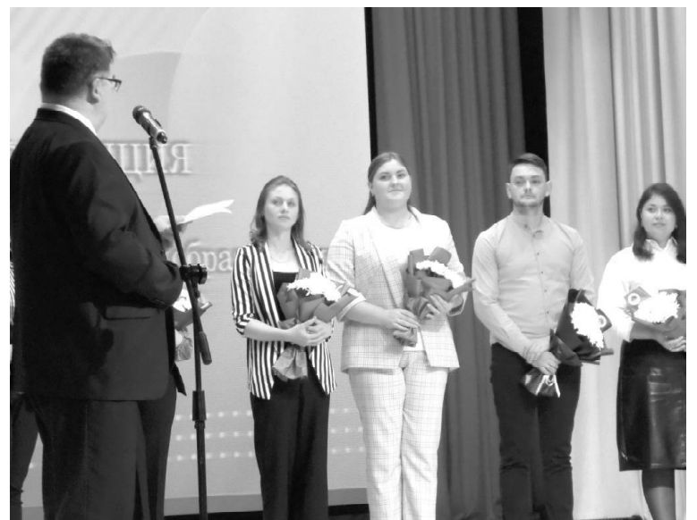
➤ Чествование молодых педагогов

Всего программы общего образования в районе реализуют 13 школ, в которых в прошлом учебном году обучались 2 053 человека. В организациях общего и дошкольного образования работают 500 человек, из них педработников – 254. Средний возраст педагогов – от 40 до 50 лет. Основной состав педагогического сообщества района имеет педагогический стаж более 20 лет. За три года закрепились двенадцать молодых специалистов из прибывших в район шестнадцати.