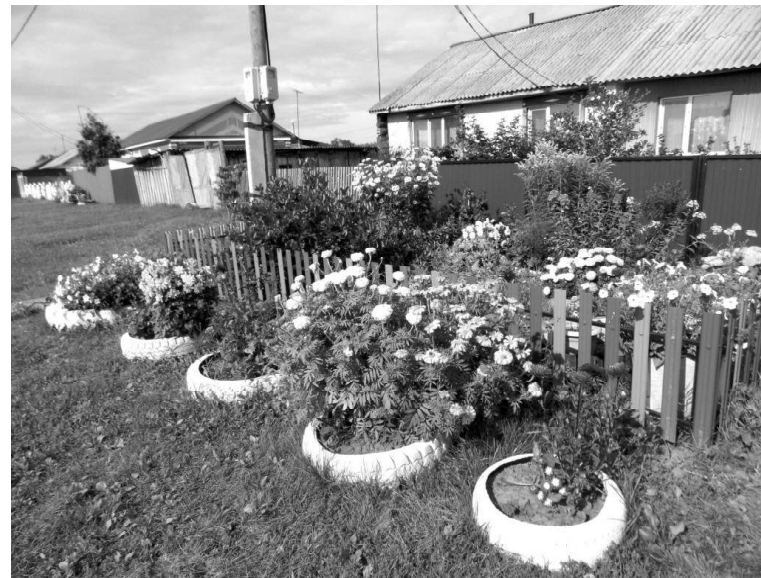
➤ Цветник Елены Кунгуровой

Дальше путь лежал на улицу Заречную. Это следующий поворот за Интернацио-