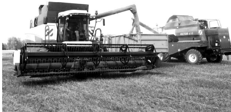
Зерно готовят к отвозке в склады