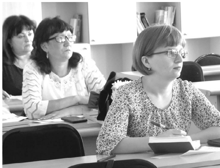
➤ Идёт работа по секциям в ВСОШ №1

вёл итоги летней оздоровительной кампании. Организация летнего отдыха в районе велась на межведомственной основе, что обеспечило её успех. В 13 образовательных организациях были реализованы программы летних пришкольных лагерей с дневным пребыванием, в которых отдохнули 1 209 детей. На базе Викуловской школы №2 традиционно была организована профильная смена для ода-