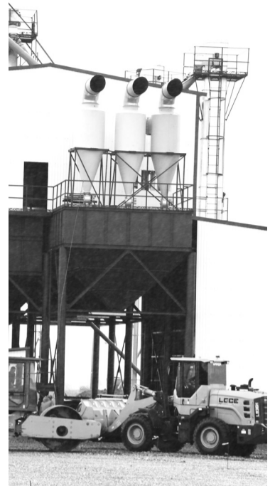
В ООО «ЗапСибХлеб-Исеть» завершается проект по приобретению, установке и вводу в эксплуатацию сушильно-сортировального комплекса.

– Это глубокая переработка леса, развитие картофелеводства, производство молока, цельномолочной продукции, сыра, придорожный сервис, расширение производства минеральной воды, организация переработки зерновых и зернообовых культур с производством круп, хлопьев, организация мест рыбалки и отдыха на природе, заготовка дикоросов (иван-чай, грибы, ягоды), тепличное хозяйство, организация производства биогаза и другие.