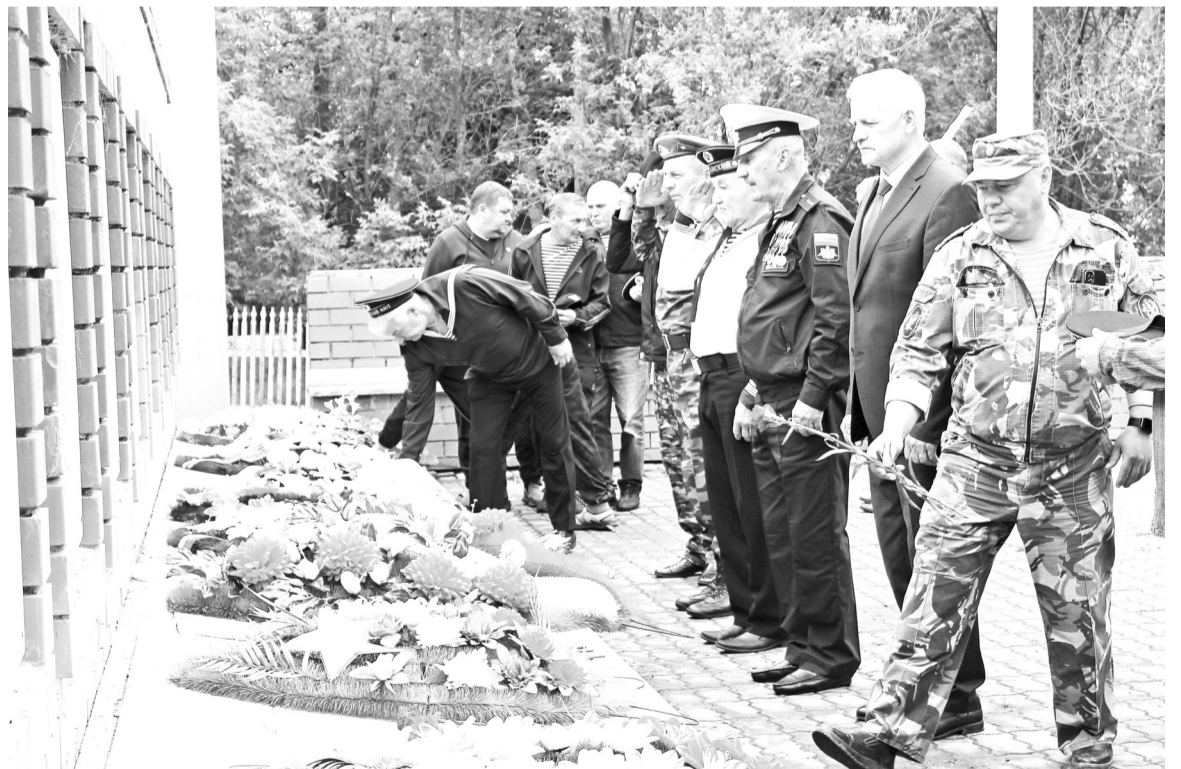
Участники митинга возложили цветы к обелиску Славы.

Военные моряки всегда пользовались особым почётом и уважением. Моряки надводных кораблей, подводники, морские десантники и другие герои, полем боя которых является море, подтвердят, что