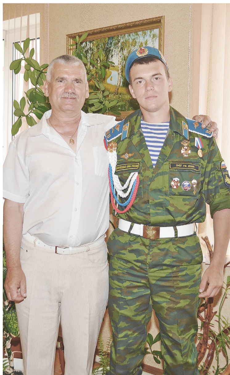
Горд отец за своего мужественного и сильного сына.